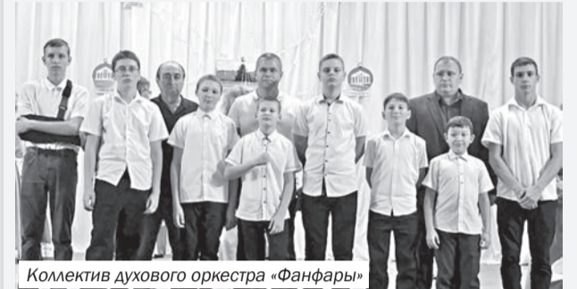
Коллектив духового оркестра «Фанфары»

2 октября в Раздольненском Доме культуры прошёл праздничный концерт, посвящённый Дню пожилого человека. Поздравить своим выступлением самых уважаемых жителей поселка, пожилых людей, были приглашены творческие коллективы из всех уголков Раздольненского района. Наш духовой оркестр «Фанфары» Березовского Дома культуры был в числе приглашённых. Молодые исполнители, участники оркестра, также пригласили своих бабушек и дедушек на праздничный концерт.