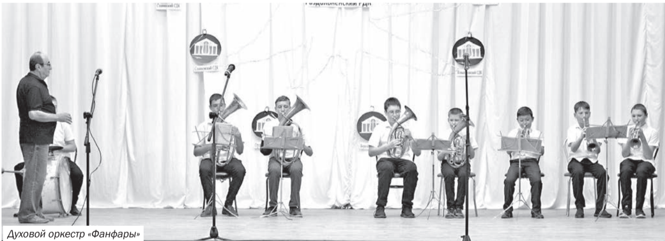
Духовой оркестр «Фанфары»