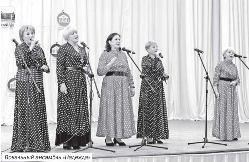
Вокальный ансамбль «Надежда»

Международный день пожилого человека – это напоминание молодому поколению о том, что люди старшего возраста больше других нуждаются в поддержке, любви, заботе. Это акцент на том, что нет ничего вечного: молодость со временем сменяется зрелостью, а потом и старостью. Ведь самый важный вклад в развитие современного общества – жизненный опыт – вносят они, пожилые люди.