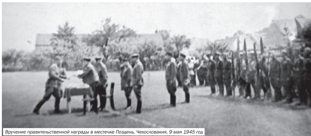
Вручение правительственной награды в местечке Поздень, Чехословакия, 9 мая 1945 год