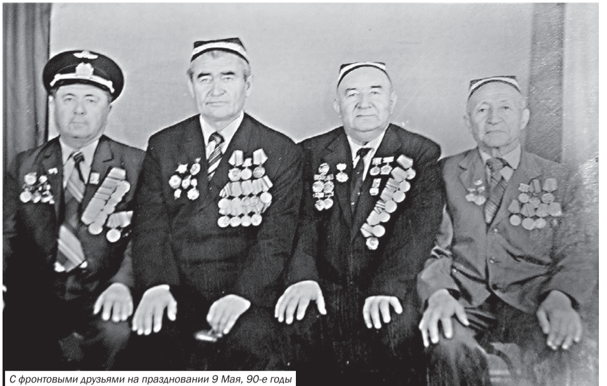
С фронтовыми друзьями на праздновании 9 Мая, 90-е годы

Оценки боевых потерь в сражении под Прохоровкой в различных источниках сильно разнятся. Но в основном эти цифры варьируются в пределах 300–400 танков. Потери советских войск за эти два дня составили более 300 танков (по некоторым зарубежным данным до 400). Немецкие войска в этом двухдневном сражении потеряли, по разным источникам, 320–400 танков.