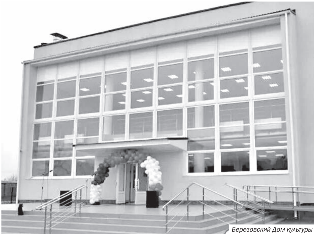
Березовский Дом культуры