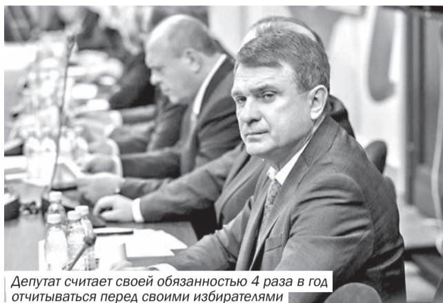
Депутат считает своей обязанностью 4 раза в год отчитываться перед своими избирателями