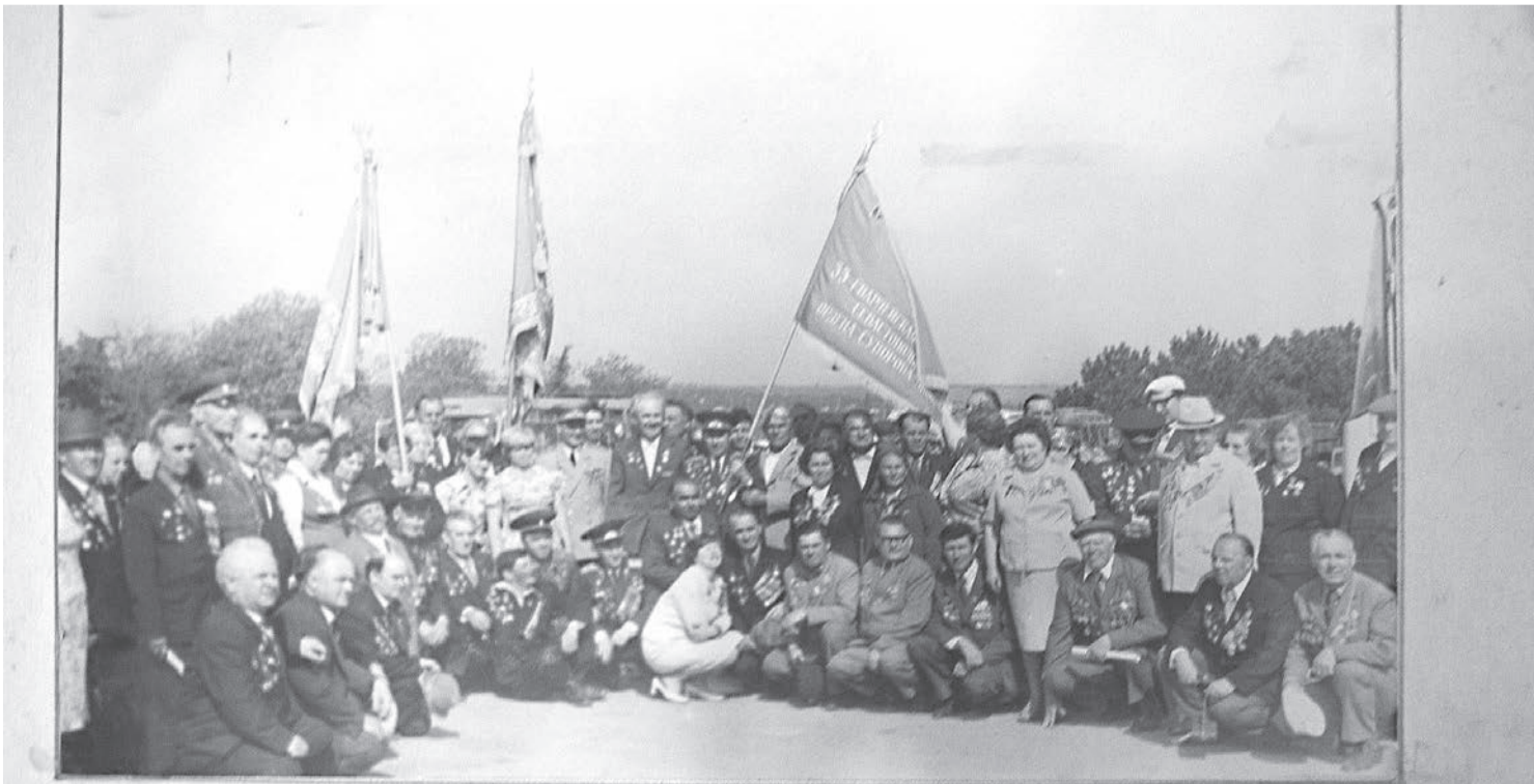
Встреча в г. Севастополе ветеранов 87-й гвардейской Перекопской орденов Красного Знамени и Суворова II ст. дивизии. 9 мая 1984 год