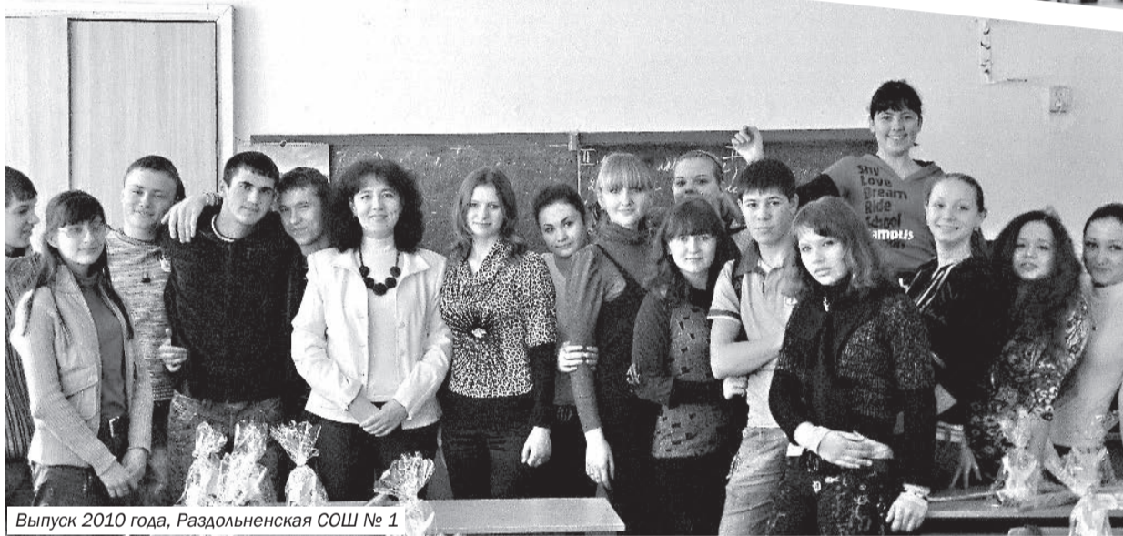
Выпуск 2010 года, Раздольненская СОШ № 1