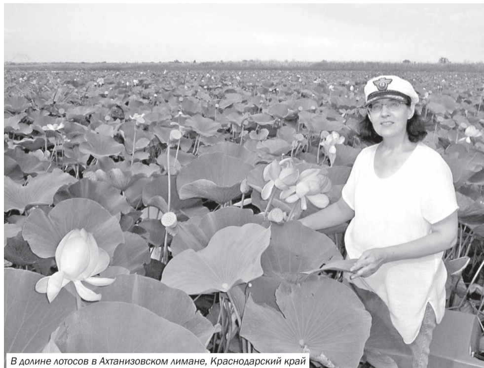
В долине лотосов в Ахтанизовском лимане, Краснодарский край