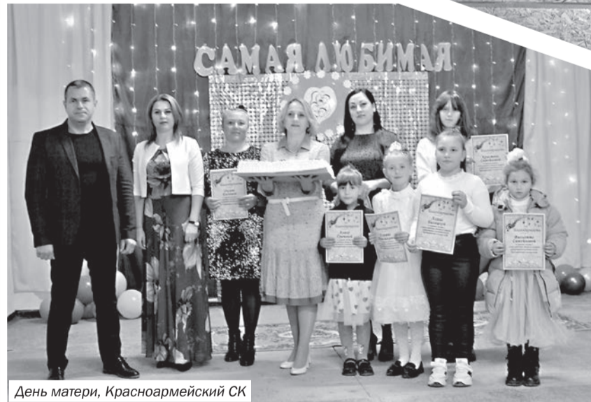
День матери, Красноармейский СК

23 ноября в Красноармейском сельском клубе состоялся отчётный концерт участников художественной самодеятельности «Самая любимая».