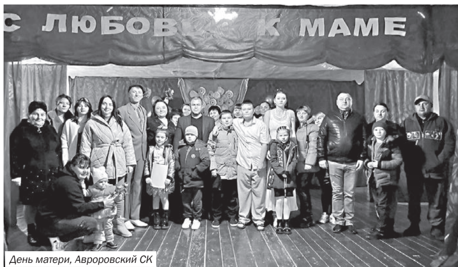
День матери, Авроровский СК