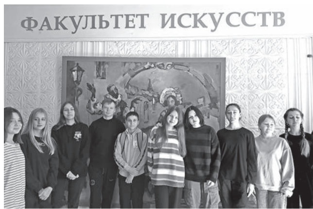
нута студентами музыкально-инструментального искусства Крымского инженерно-педагогического университета имени Февзи Якубова.

Надеемся, что в будущем наши учащиеся заинтересуются профессиональным музыкальным образованием и ста-