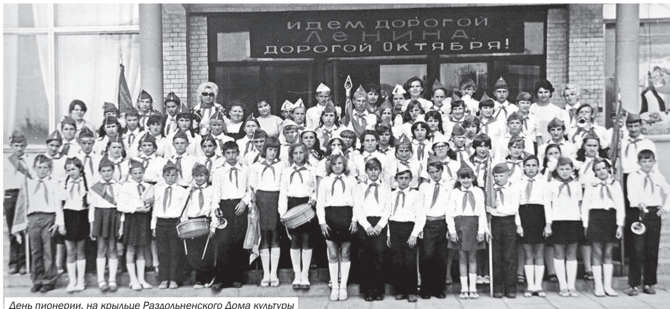
День пионерии, на крыльце Раздольненского Дома культуры