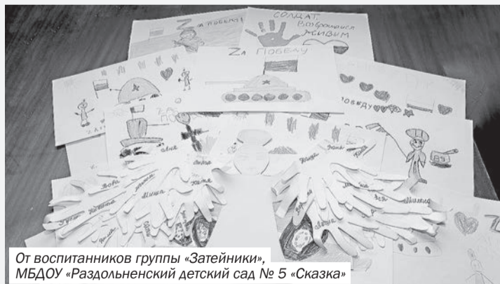
От воспитанников группы «Затейники», МБДОУ «Раздольненский детский сад № 5 «Сказка»

Я знаю, что врага ты победишь, Ведь ты за правду и за Родину стоишь. Твой русский дух и волю не сломать, А я тебя с Победой буду ждать!