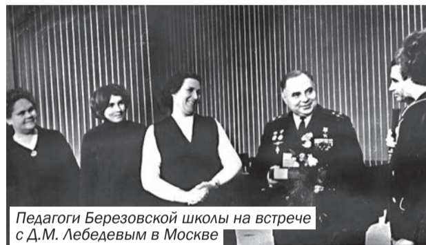
Педагоги Березовской школы на встрече с Д.М. Лебедевым в Москве

Решительный и волевой разведчик одерживал немало побед и в воздушных сражениях с вражескими лётчиками. Вот несколько эпизодов, рассказанных самим лётчиком.