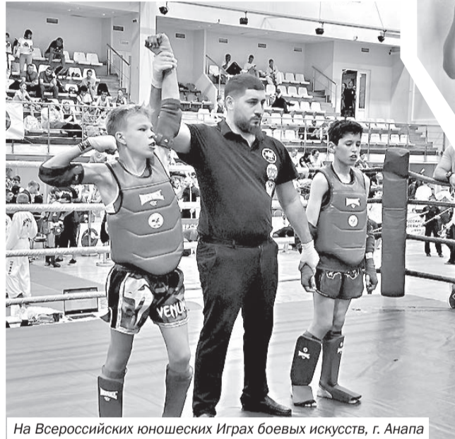
На Всероссийских юношеских Играх боевых искусств, г. Анапа