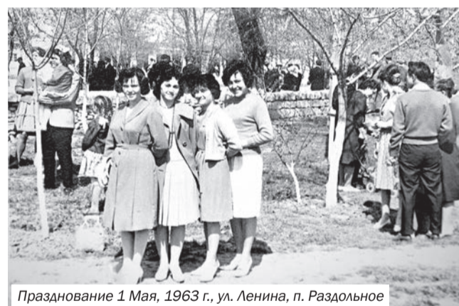
Празднование 1 Мая, 1963 г., ул. Ленина, п. Раздольное