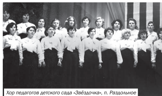
Хор педагогов детского сада «Звёздочка», п. Раздольное