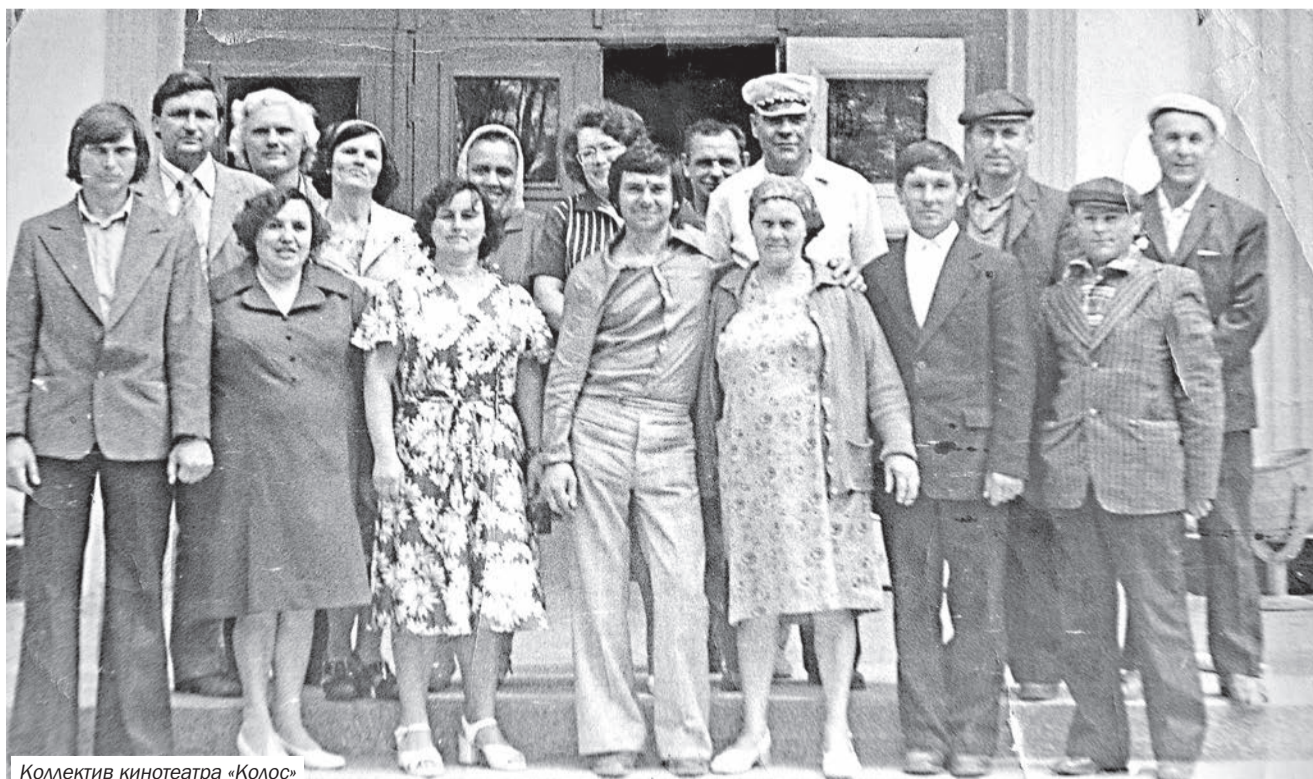
Коллектив кинотеатра «Колос»

И если ответят, что это не нужно, Я спорить не буду, пусть время решит. Но думаю, если мы всё восстановим, Потомки нас будут благодарить.