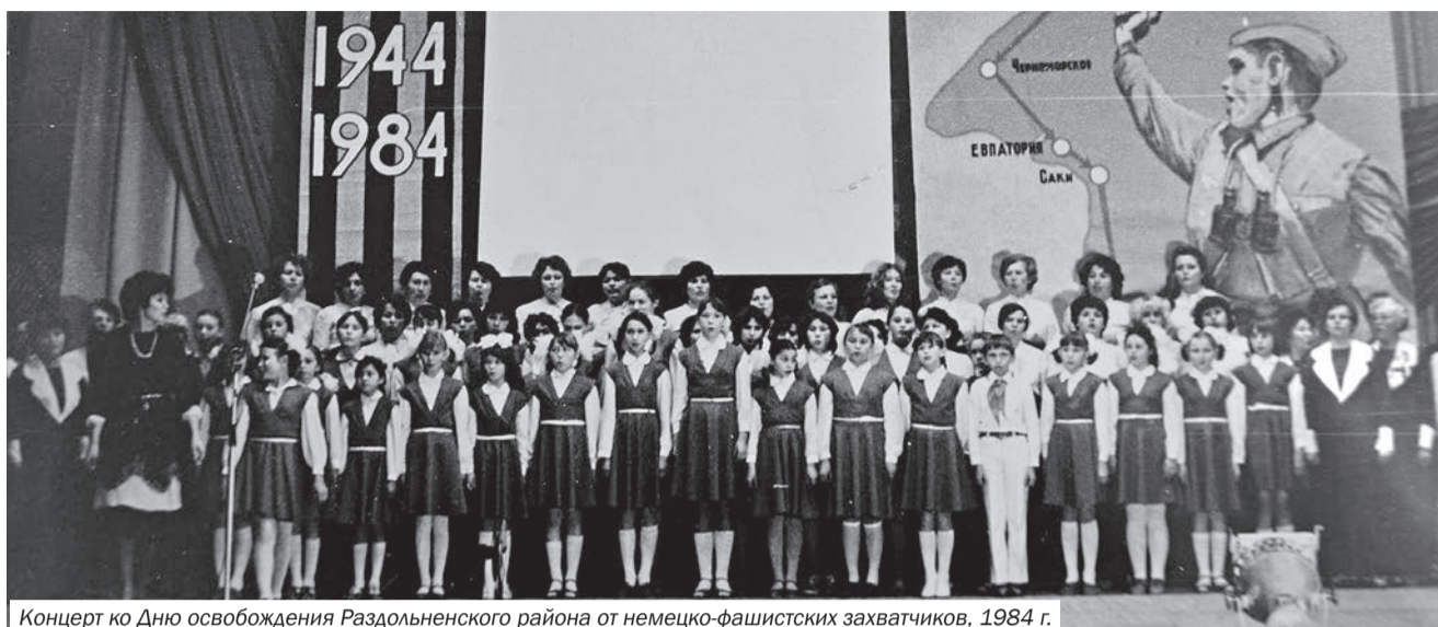
Концерт ко Дню освобождения Раздольненского района от немецко-фашистских захватчиков, 1984 г.