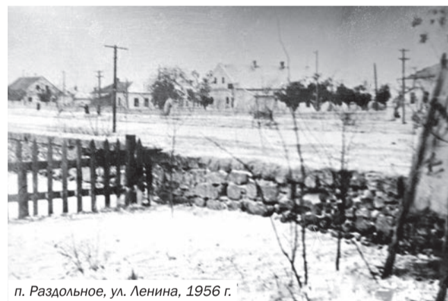
п. Раздольное, ул. Ленина, 1956 г.