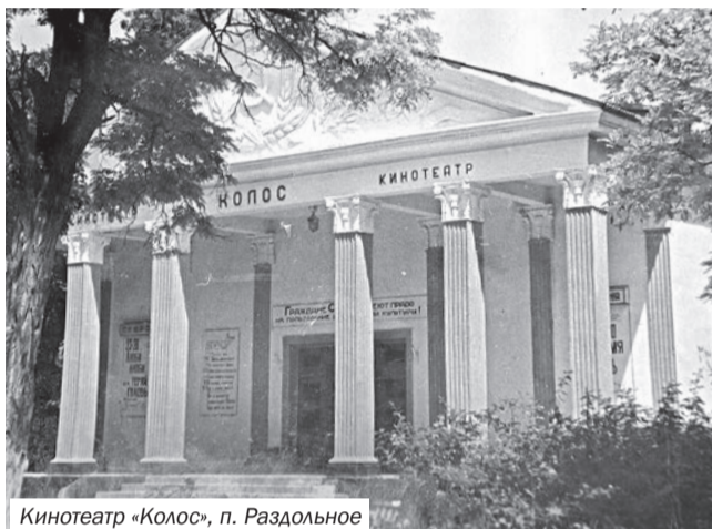
Кинотеатр «Колос», п. Раздольное