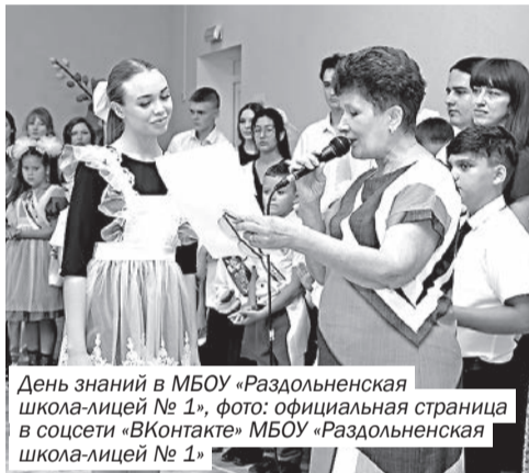
День знаний в МБОУ «Раздольненская школа-лицей № 1»