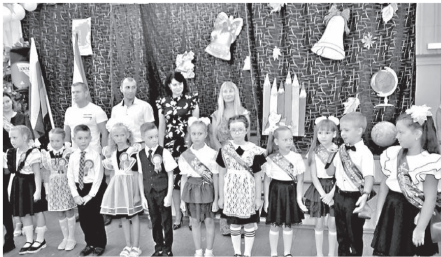
День знаний в МБОУ «Раздольненская школа-гимназия № 2 им. Л. Рябики»