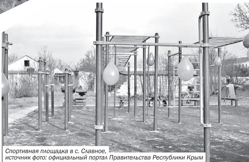
Спортивная площадка в с. Славное

Гордостью славновцев и по сей день является народный краеведческий музей, который проводит большую работу по военно-патриотическому воспитанию молодого поколения, по изучению родного края. В плане создания музея было намечено отразить природу и дореволюционное прошлое края, героические события гражданской и Великой Отечественной войн, этапы развития хозяйства села. Он был открыт 9 мая 1975 года, в день 30-летия Победы советского народа в Великой Отечественной войне. Расположен он на центральной усадьбе, в здании, фронтон которого украшен мозаичным панно, являющимся своеобразным прологом к основной экспозиции. В первом зале представлены экспонаты, рассказывающие о геологическом строении Крымского полуострова, о полезных ископаемых и экономике края. В отдельных витринах – керамические изделия и посуда, фрагменты оружия, украшений и другие находки, обнаруженные археологами в 1973 – 1978 годах при раскопках памятников древности, которых на территории совхоза насчитывается без малого полсотни. На степных просторах сельского совета, как и всего района, в древности обитали различные кочевые племена. Вблизи сел Славное, Котовское, Рылеевка обнаружены три скифских курганных могильника.