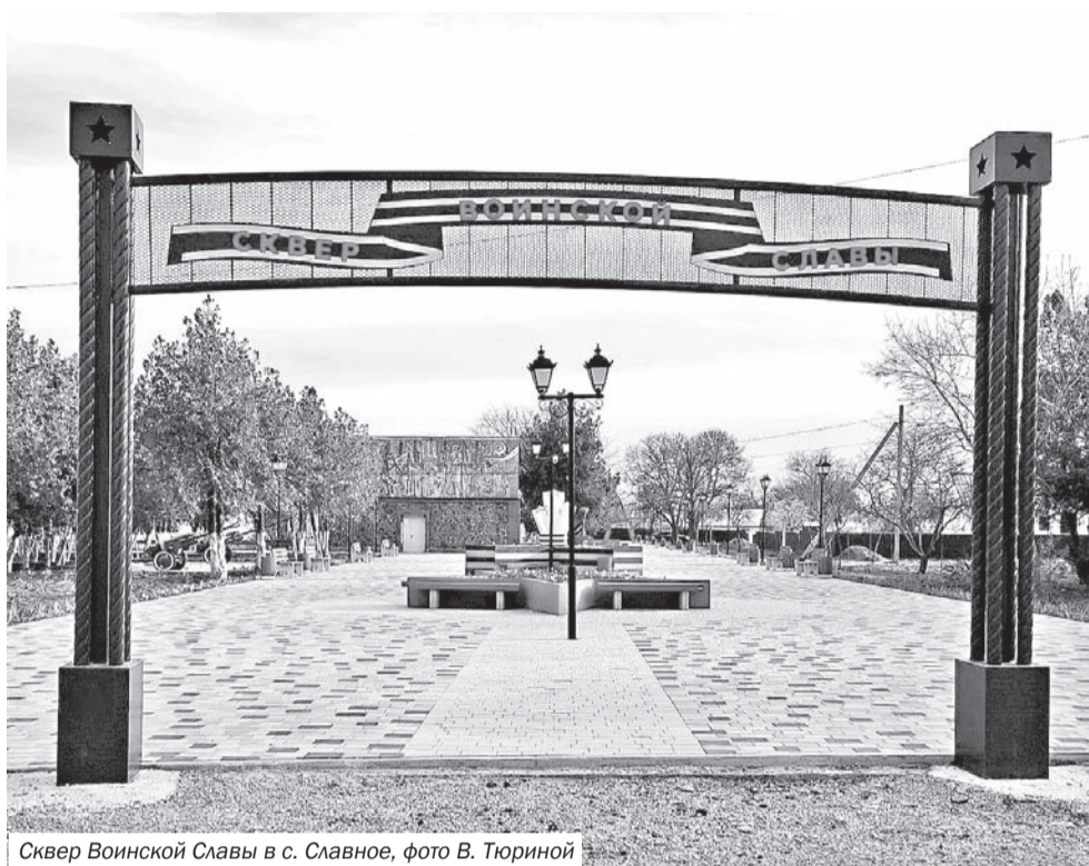
Сквер Воинской Славы в с. Славное

Старые фотографии и архивные документы, кустарные изделия и предметы крестьянского быта свидетельствуют о нищенском существовании сельского населения края в дооктябрьское время.