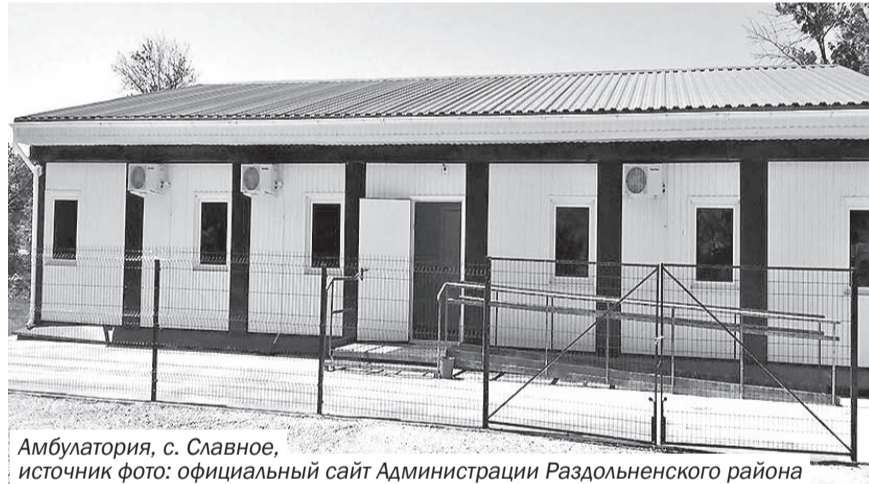
Амбулатория, с. Славное

От всей души хочется поздравить славновцев с праздником и пожелать мира, добра, благополучия и процветания своему родному селу, развитию которого в своё время много ресурсов отдала и моя семья, а село отплатило за это доброй монетой. Дальше – только вперёд!