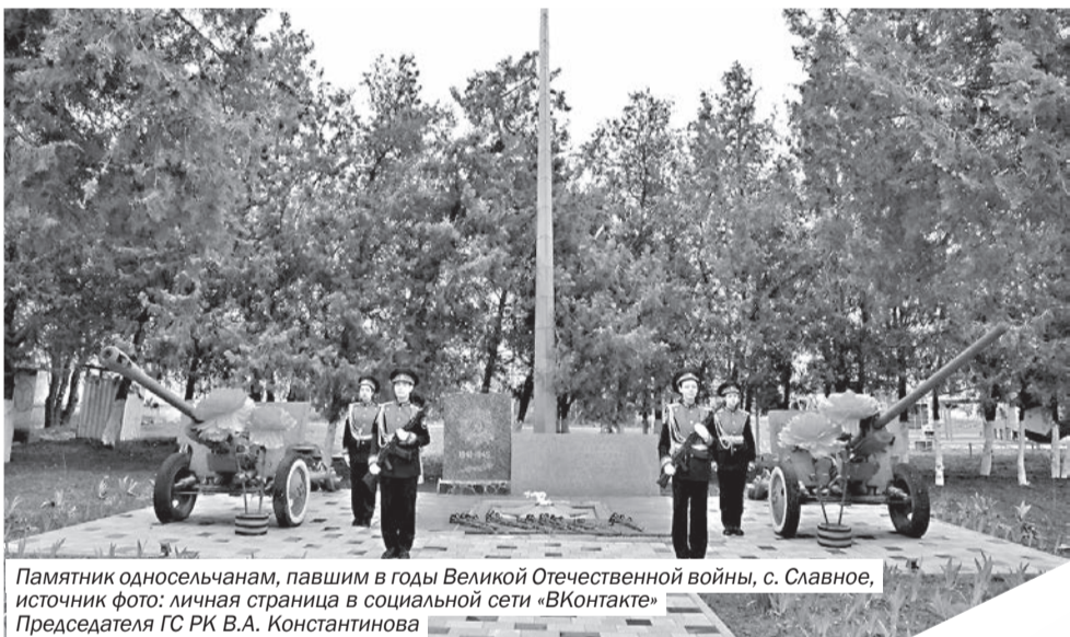
Памятник односельчанам, павшим в годы Великой Отечественной войны, с. Славное