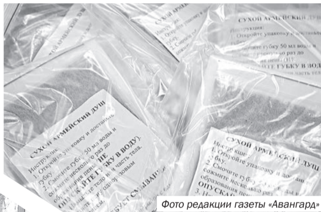
Фото редакции газеты «Авангард»

горожанам, равнодушны к тому, что бомбят Донецк и Луганск, не задумываясь почему, главное, – у них всё спокойно.