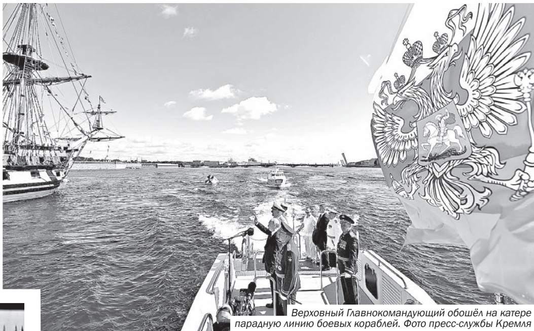
Верховный Главнокомандующий обошёл на катере парадную линию боевых кораблей.

Парад завершился прохождением торжественным маршем на Сенатской площади расчётов военнослужащих, воспитанников довузовских учреждений Военно-Морского Флота и юнг Юнармии.