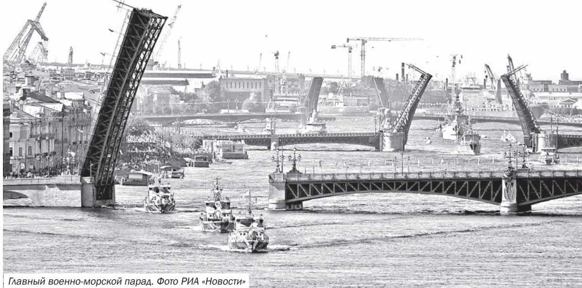
Главный военно-морской парад.

Не раз русский флот неприступной крепостью вставал на пути врага. Мы помним героическую оборону Порт-Артура и Севастополя, Петропавловска и Ленинграда, мужество морских пехотинцев, моряков, защищавших Москву, Сталинград, Заполярье, бравших плацдармы на Днепре и Дунае.