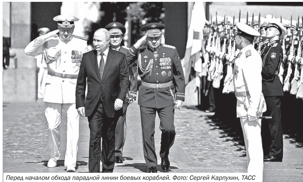
Перед началом обхода парадной линии боевых кораблей.

На мероприятии также присутствовали лидеры и главы делегаций африканских стран, которые принимали участие во втором саммите Россия – Африка. Президент России поприветствовал иностранных гостей, а по окончании парада кратко пообщался с Президентом Республики Конго Дени Сассу-Нгессо и Президентом переходного периода Республики Буркина-Фасо Ибраимом Траоре.