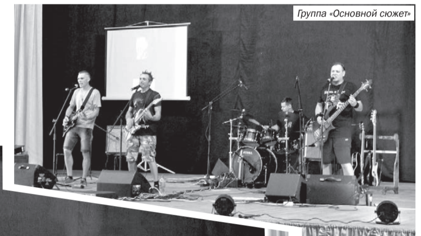
Группа «Основной сюжет»