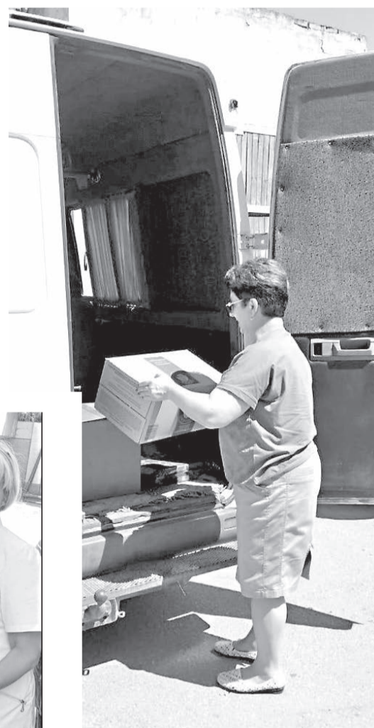
Прощаясь, бойцы от всего сердца поблагодарили жителей Раздольненского района за помощь и поддержку.

нитарный груз, в который вошли адресные посылки, предметы из списка ребят, продукты питания, письма поддержки, рисунки от детей, маскировочные сети, медикаменты и многое другое.