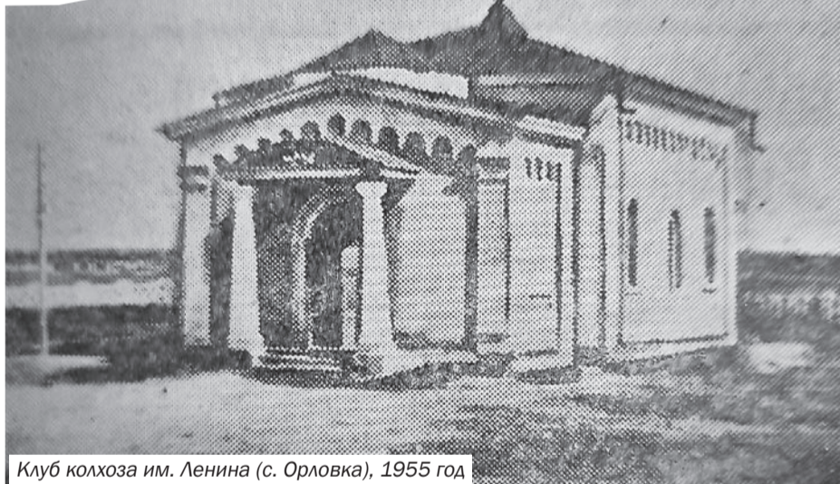
Клуб колхоза им. Ленина (с. Орловка), 1955 год

Из статьи «Каким будет Северо-Крымский канал» в № 93 от 14 ноября 1954 года: «...Северо-Крымский канал протянется на 360 км. Будут сооружены также три магистральных канала – Раздольненский длиной 70 км,