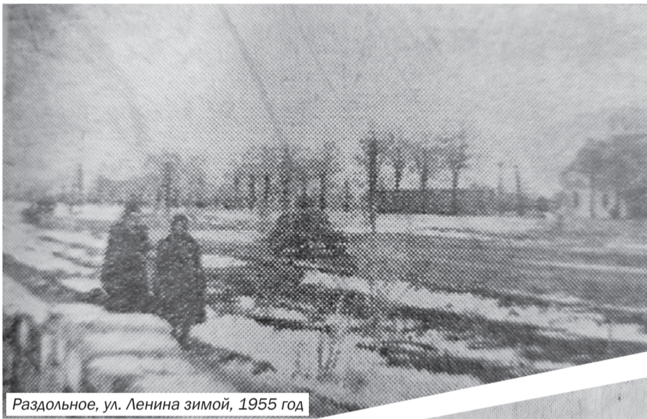
Раздольное, ул. Ленина зимой, 1955 год

Из статьи «На степных просторах» (13.02.1955, № 13): «Раздольненский, Евпаторийский и Черноморский районы – это обширный земледельческий край, достигший высокого развития сельского хозяйства и культуры