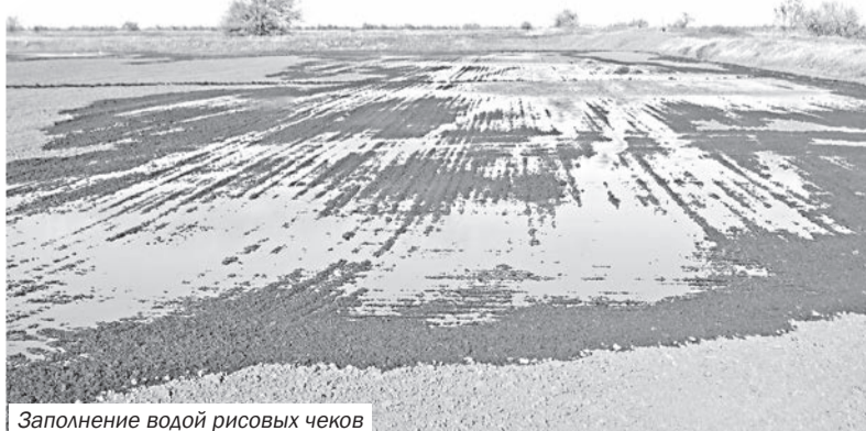
Заполнение водой рисовых чеков

Справка: В текущем году в Раздольненском районе сеют рис следующие сельхозпредприятия с планируемыми посевными площадями: КФК «Хлебороб» – 352 га, ООО «Чернышевское22» – 480 га, ООО «Нива» – 256 га, ООО «ТПК «Инфокар» – 177,9 га.