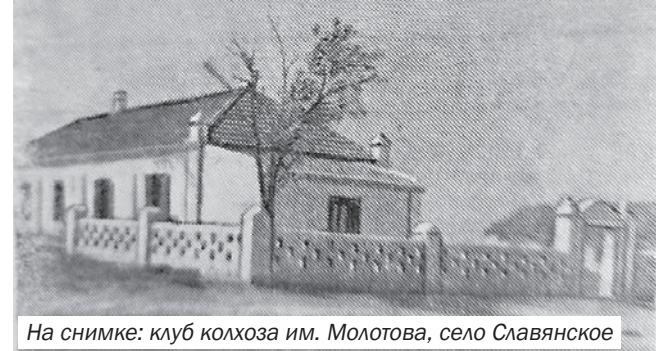
На снимке: клуб колхоза им. Молотова, село Славянское

• В колхозах и МТС района проведены значительные работы по строительству и ремонту культпросветучреждений – клубов, библиотек и изб-читален.