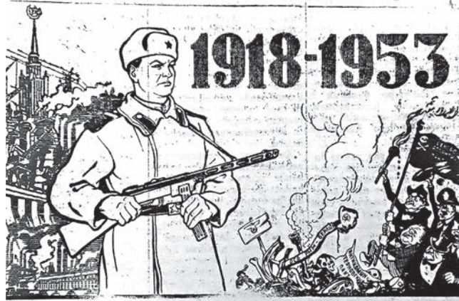
Мы сильны! Берегись, поджигатель войны, Не забудь, чем кончаются войны!

• В 1953 году отмечается 35-летие Советской Армии и Военно-Морского флота. 23 февраля 1918 года, когда молодые отряды Советской Армии наголову разбили под Псковом и Нарвой войска немецких захватчиков, стало днём рождения наших славных Вооружённых Сил.