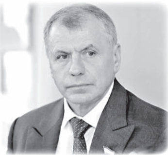
Председатель Государственного Совета Республики Крым Владимир Константинов

Желаю крепкого здоровья, благополучия и согласия в семье!