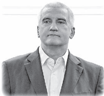
Глава Республики Крым Сергей Аксёнов