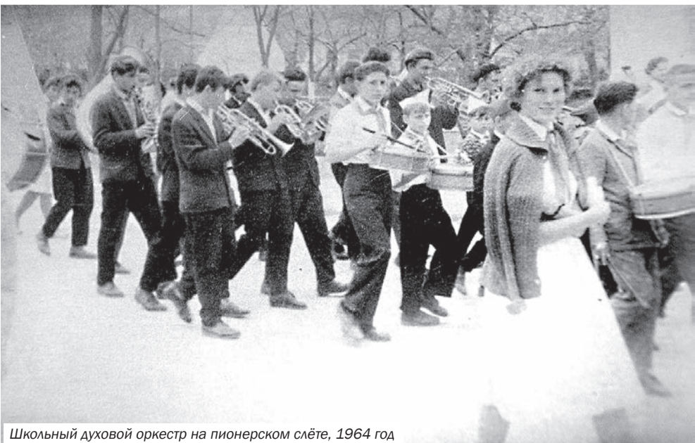
Школьный духовой оркестр на пионерском слёте, 1964 год