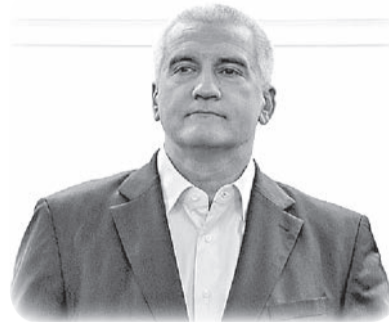
Глава Республики Крым Сергей Аксёнов

С праздником, друзья! Спасибо всем за труд и любовь к Родине! Спасибо нашим защитникам! Победа будет за нами!