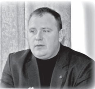
Глава Администрации Раздольненского района Денис Олейник