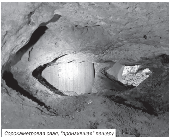
Сорокаметровая свая, «пронизывшая» пещеру