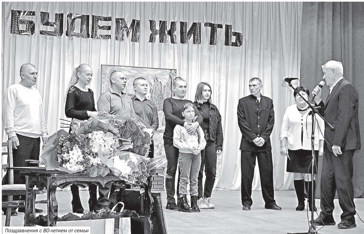
Поздравления с 80-летием от семьи