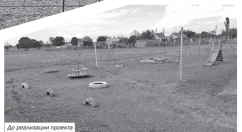
До реализации проекта

• В селе Ручьи Раздольненского района в рамках проекта инициативного бюджетирования в 2022 году проведены работы по текущему ремонту наружного освещения улиц 40 лет Победы, Восточной, Гагарина, Школьной, Гоголя, 50 лет Октября, Леси Украинки, Канакова. «Инициативный проект был направлен на создание благоприятных условий для жителей населённого пункта и повышение безопасности пешеходов и водителей транспортных средств. Общая стоимость реализации проекта составила более 1 млн 300 тыс. руб. Из них субсидия из бюджета Республики Крым – 1 млн руб.», – рассказал глава Ручьёвского сельского поселения Александр Васильевич Ушаков. Также в рамках этой программы в прошлом году в селе Ручьи состоялось открытие долгожданного объекта – благоустроенной общественной территории площадью