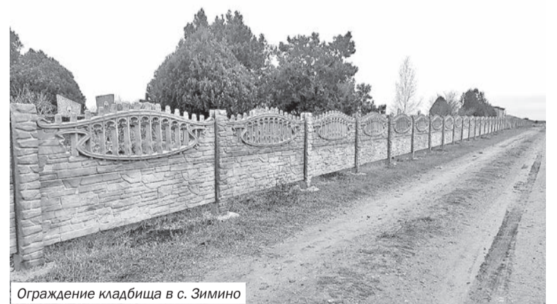
Ограждение кладбища в с. Зимино

сельских поселений и благодарят жителей сельских поселений, спонсоров – всех, кто принимает участие в конкурсе, кому безразлично, как будет выглядеть родное село.