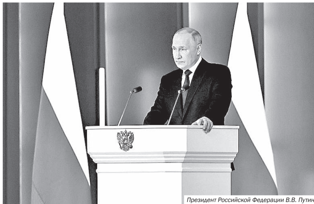
Президент Российской Федерации В.В. Путин

СПРАВКА. Послание Президента Российской Федерации Федеральному Собранию было оглашено в Гостинном Дворе в городе Москве. Данное Послание для Владимира Путина стало 18-м по счёту. На оглашение Послания были приглашены члены Совета Федерации, депутаты Государственной Думы, члены Правительства, руководители Конституционного и Верховного судов, губернаторский корпус, председатели законодательных собраний субъектов федерации, Центральной избирательной комиссии, Счётной и Общественной палат, главы традиционных конфессий, общественные деятели, участники специальной военной операции.