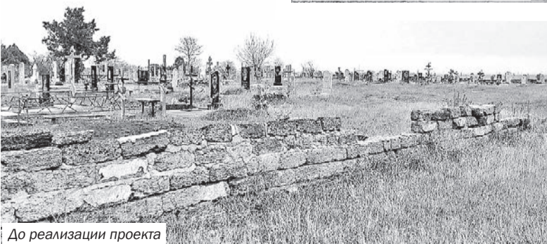
До реализации проекта

• В селе Стерегущее Славновского сельского поселения благодаря победе в конкурсе проектов инициативного бюджетирования в 2022 году был произведён капитальный ремонт пешеходной дорожки по улице А. Кима. «Инициативный проект предусматривал укладку бордюров, тротуарной плитки и установку шести фонарей. Общая стоимость реализации проекта составила более 1 млн руб., в том числе субсидия из бюджета Республики Крым – более 900 тыс. руб., – рассказывает глава Слав-