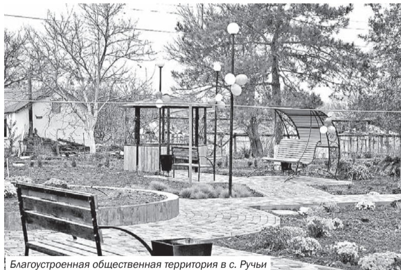
Благоустроенная общественная территория в с. Ручьи

186 заявок от сельских и городских поселений 13 муниципальных районов Республики Крым. Победу одержали 63 проекта из 43 сельских поселений 11 районов Крыма. Их общая стоимость составила 67,5 млн рублей. Из республиканского бюджета на реализацию программы выделена субсидия в размере 52,6 млн рублей.