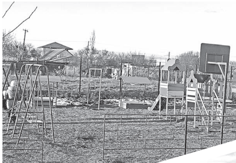
Детская игровая площадка в с. Аврора