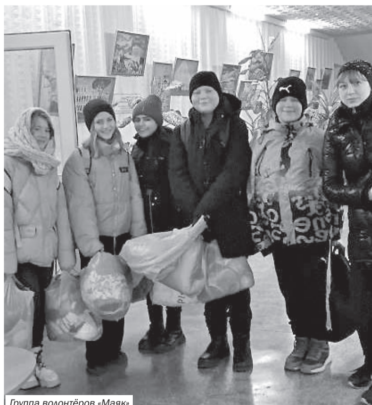
Группа волонтеров «Маяк»

Неправильно считать, что волонтерская деятельность предполагает только отдачу сил, времени, душевной теплоты, она компенсируется тем моральным удовлетворением, которое волонтеры испытывают от своей работы. Вместе с тем они общаются с людьми, близкими им по духу, имеющими те же интересы. Волонтерская работа позволяет детям и взрослым открыть и развить в себе новые способности, которым до этого, возможно, негде было проявиться: навыки общения, разрешения конфликтов, проведения групповых занятий, мастер-классов. Возможно, это тот путь, который наполнит их жизнь новым смыслом и навсегда определит жизненные установки, идеалы и принципы.