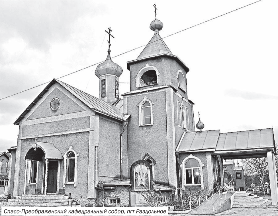
Спасо-Преображенский кафедральный собор, пгт Раздольное