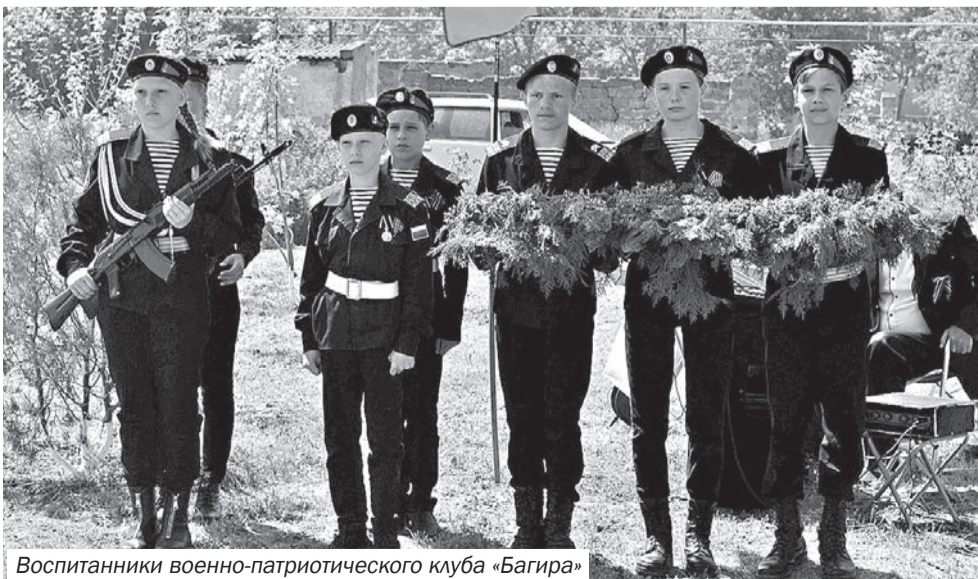
Воспитанники военно-патриотического клуба «Багира»

После мероприятия в сельском Доме культуры прошёл праздничный концерт, в исполнении местных солистов прозвучали песни военных лет.