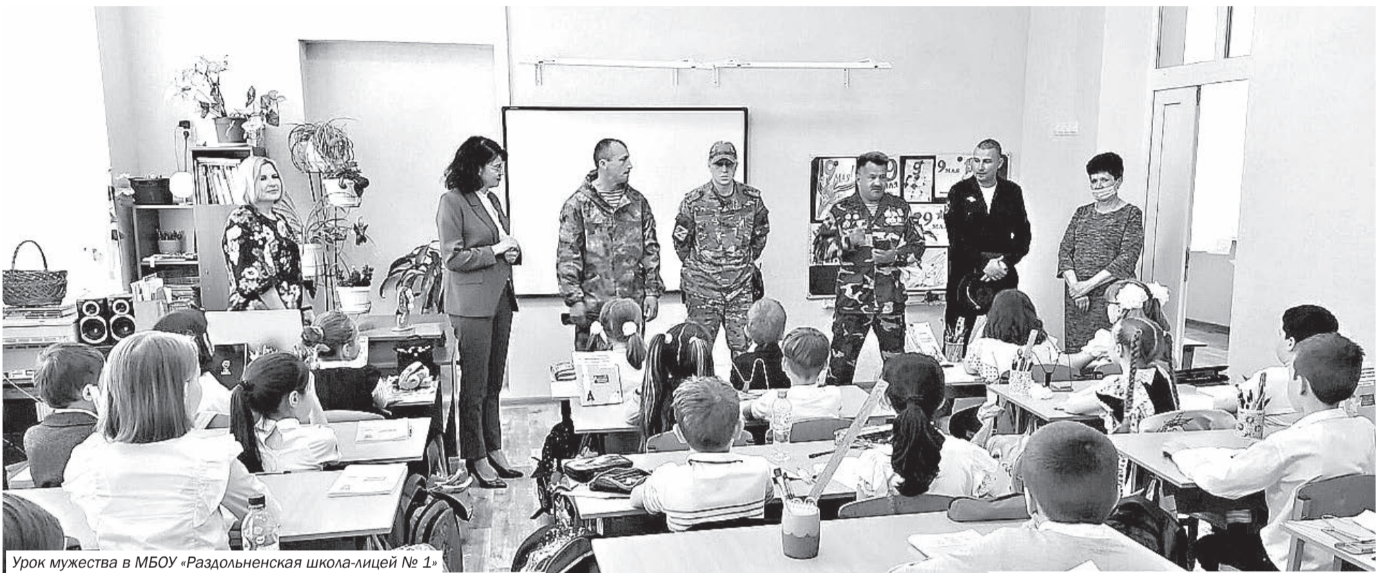
Урок мужества в МБОУ «Раздольненская школа-лицей № 1»