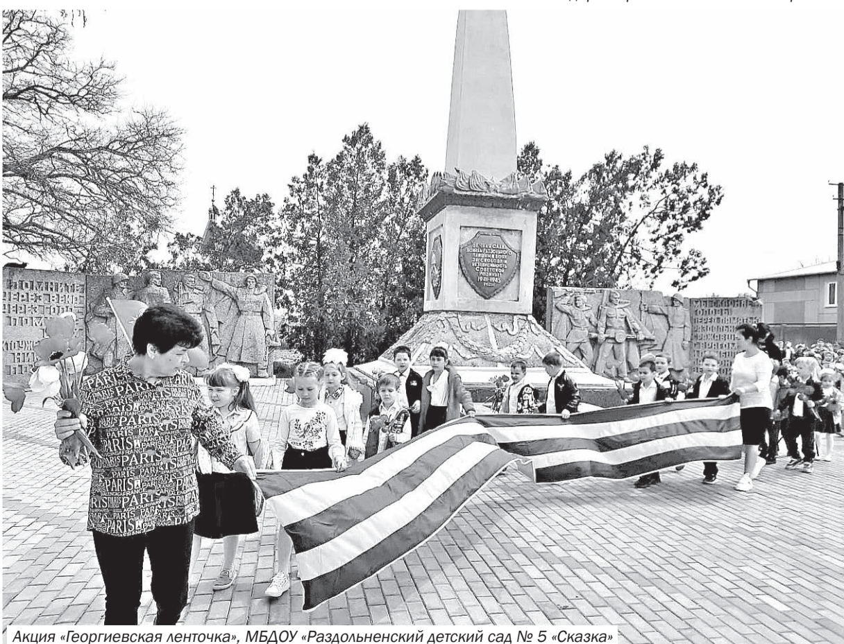
Акция «Георгиевская ленточка», МБДОУ «Раздольненский детский сад № 5 «Сказка»

Мы всегда будем помнить и чтить тех, кто сражался на фронтах Великой Отечественной войны, трудился в тылу, приближая Великую Победу!