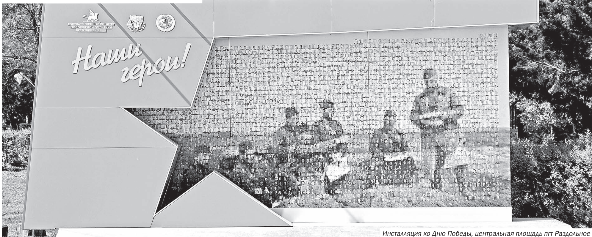
Инсталляция ко Дню Победы, центральная площадь пгт Раздольное