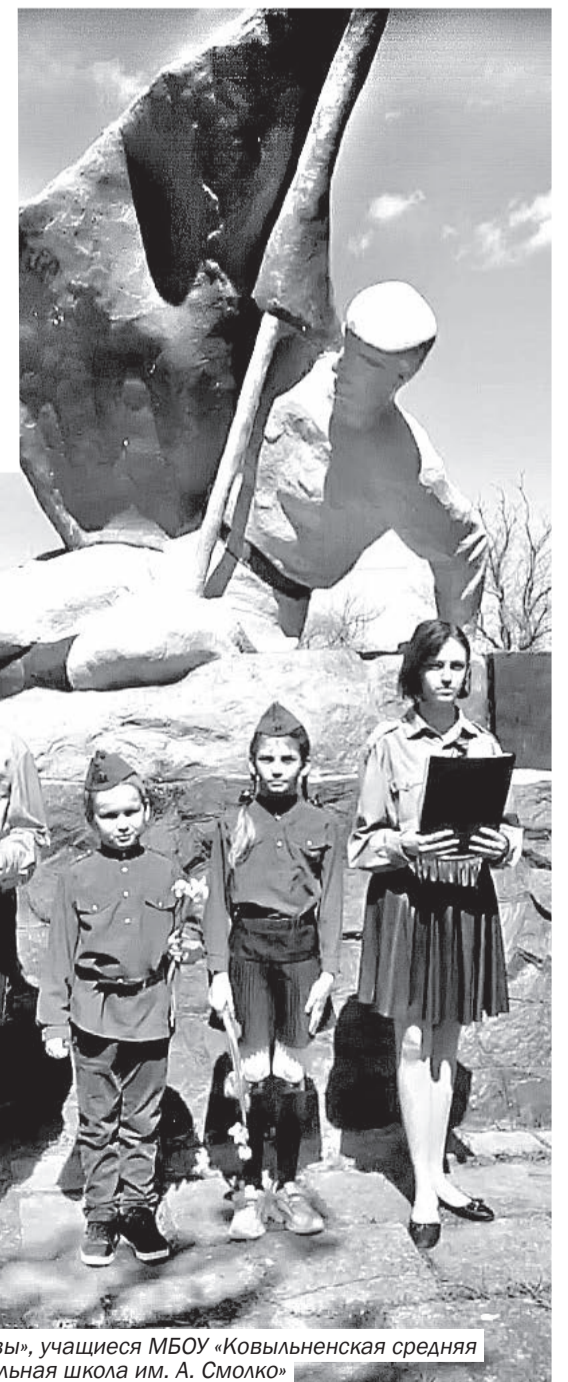
Акция «Герои живы», учащиеся МБОУ «Ковыльненская средняя общеобразовательная школа им. А. Смолко»