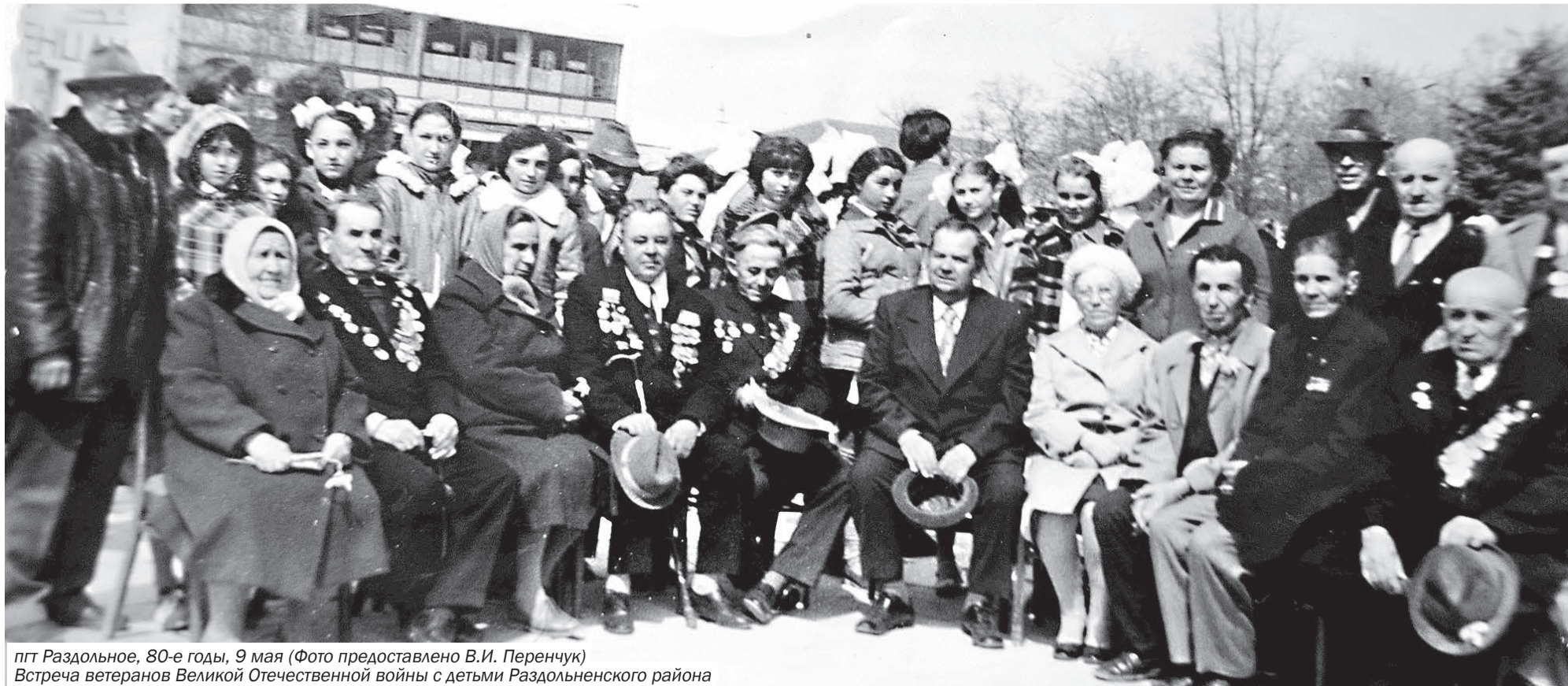
пгт Раздольное, 80-е годы, 9 мая Встреча ветеранов Великой Отечественной войны с детьми Раздольненского района