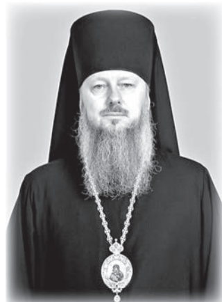
Преосвященнейший Алексей, епископ Джанкойский и Раздольненский