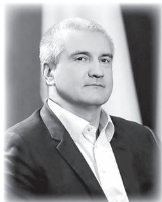
Глава Республики Крым Сергей Аксёнов