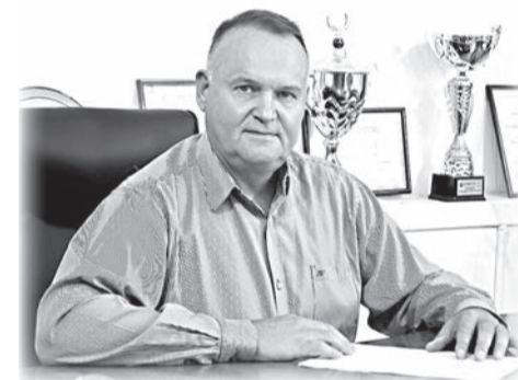
Глава Администрации Раздольненского района Андрей Захаров

В этот особенный день я желаю вам благоденствия, очищения души под благодетельный пасхальный звон колоколов. Пусть такие ценности, как милосердие, сострадание, любовь к ближнему, уважение к человеческой личности, и впредь остаются основополагающими для всех нас вне зависимости от религиозной и национальной принадлежности. Желаю вам житейского благополучия, земной мудрости, успехов во всех начинаниях!