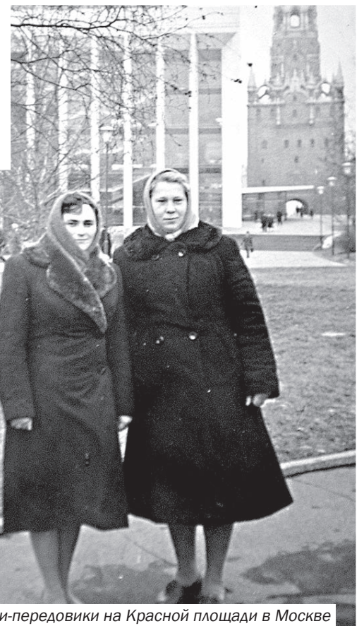
Виноградари-передовики на Красной площади в Москве