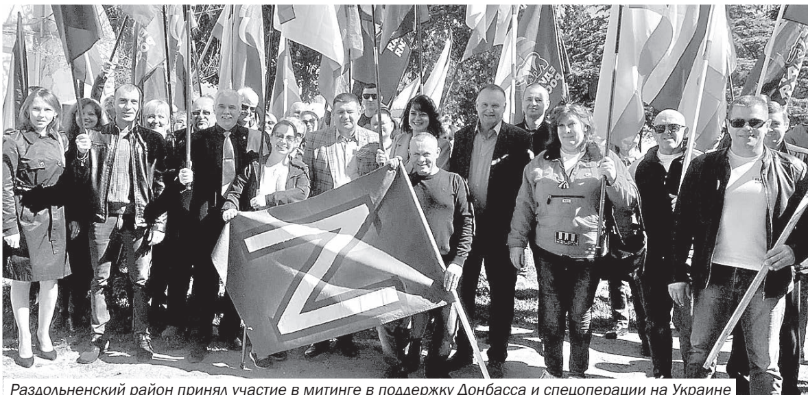
Раздольненский район принял участие в митинге в поддержку Донбасса и спецоперации на Украине