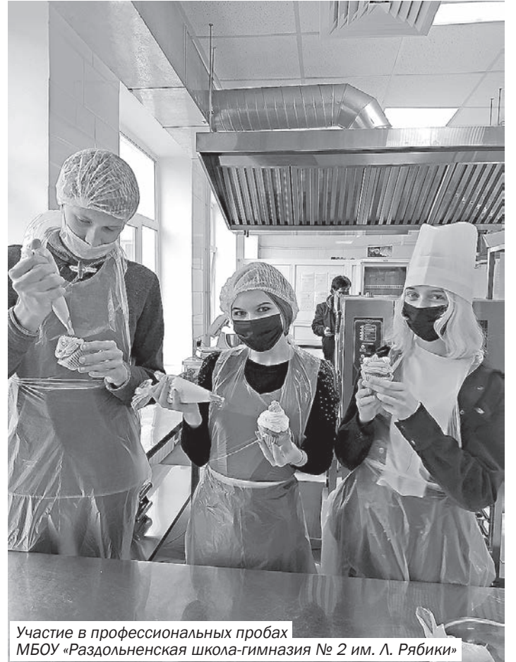
Участие в профессиональных пробах МБОУ «Раздольненская школа-гимназия № 2 им. Л. Рябики»

Считаю, что немаловажную роль в приобретении детьми качественных знаний играют комфортные условия для их получения.