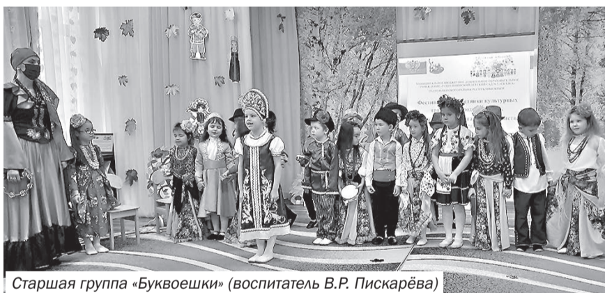
Старшая группа «Буквоешки» (воспитатель В.Р. Пискарёва)

на музыкальных инструментах. Открыл Фестиваль детский ансамбль «Ладушки» песней «Росиночка Россия» (руководитель-педагог дополнительного образования Е.А. Терещенко).