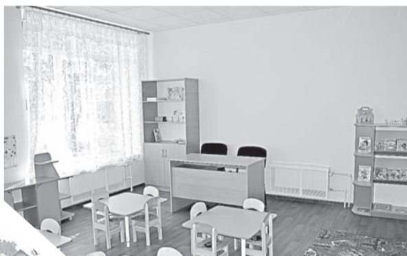
МБДОУ «Ручьёвский детский сад «Берёзка»