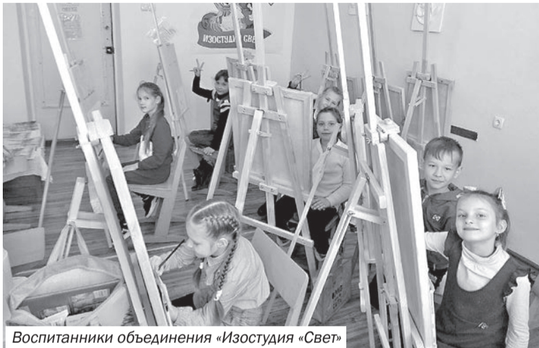
Воспитанники объединения «Изостудия «Свет»

В рамках национального проекта «Образование» в образовательных учреждениях Раздольненского района реализуется региональный проект «Успех каждого ребёнка», направленный на развитие дополнительного образования, раскрытие способностей и талантов у детей.