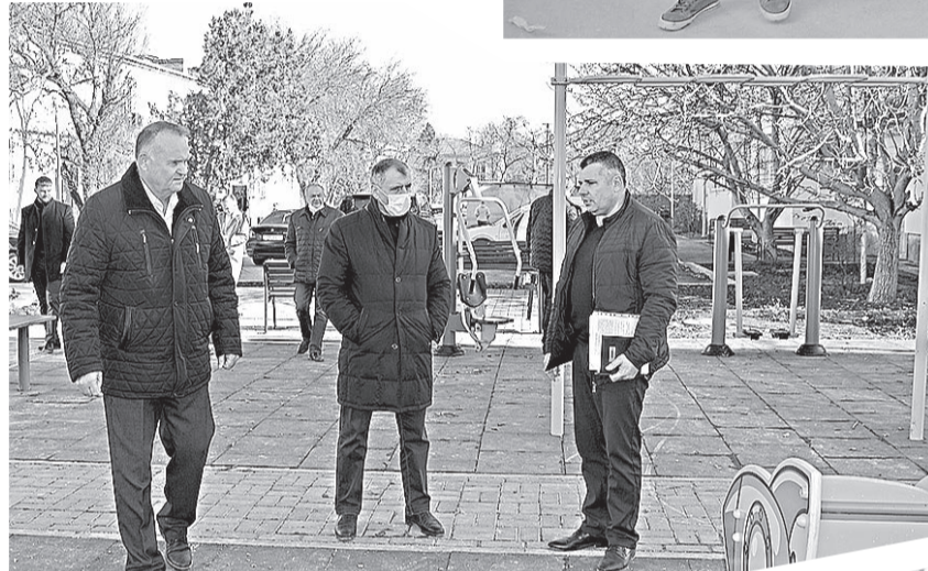
Осмотр благоустроенной придомовой территории в пгт Раздольное