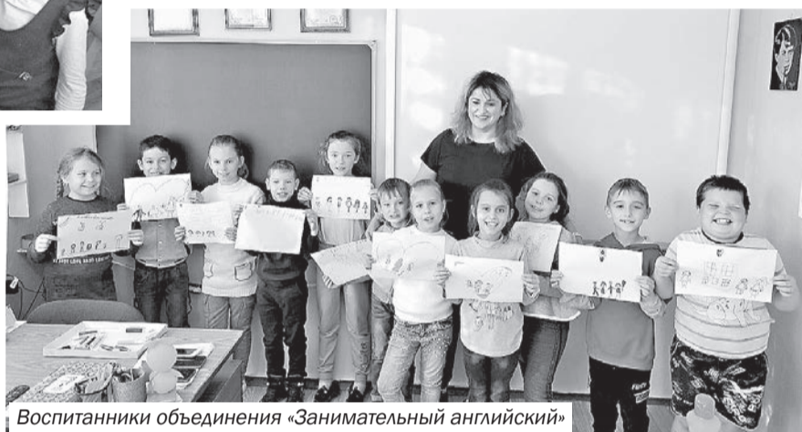
Воспитанники объединения «Занимательный английский»

незаметно, ребята с энтузиазмом показывают плоды своей работы», – отмечает директор Центра детского и юношеского творчества.