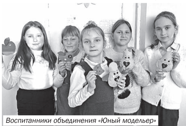
Воспитанники объединения «Юный модельер»