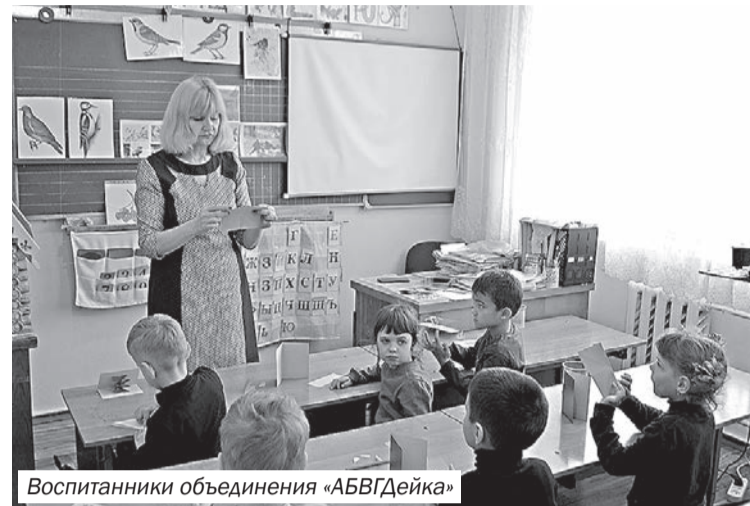
Воспитанники объединения «АБВГДейка»

«Мы живём в век технического прогресса. Поэтому у ребят всё больше проявляется интерес к кружкам технической направленности. Судо- и авиамоделирование – увлекательное, скрупулёзное направление, открывшееся в Центре в 2020 году благодаря проекту «Успех каждого ребёнка». На данный момент в объединении «Юный мастер» 45 воспитанников в возрасте от 8 до 17 лет. На занятиях ребята осваивают основы 3D-моделирования, с помощью 3D-принтера изготавливают различные предметы, сувениры, модели самолётов и кораблей. Также воспитанники осваивают робототехнику. Руководитель А.А. Третьяк даёт детям широкий спектр знаний, разноплановые задачи, за занятиями время проходит