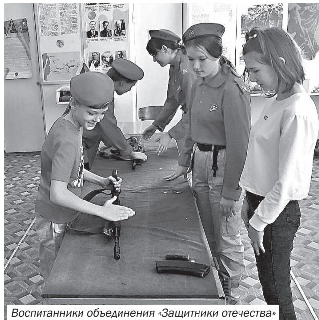
Воспитанники объединения «Защитники отечества»

«Мы не боимся усовершенствовать направления, не боимся экспериментировать, говорит руководитель учреждения дополнительного образования. – Здесь ребёнку должно нравиться. Каждый педагог – это часть большой и дружной команды, работающей на благо и процветание Центра детского и юношеского творчества, который оправданно носит своё название Центр».