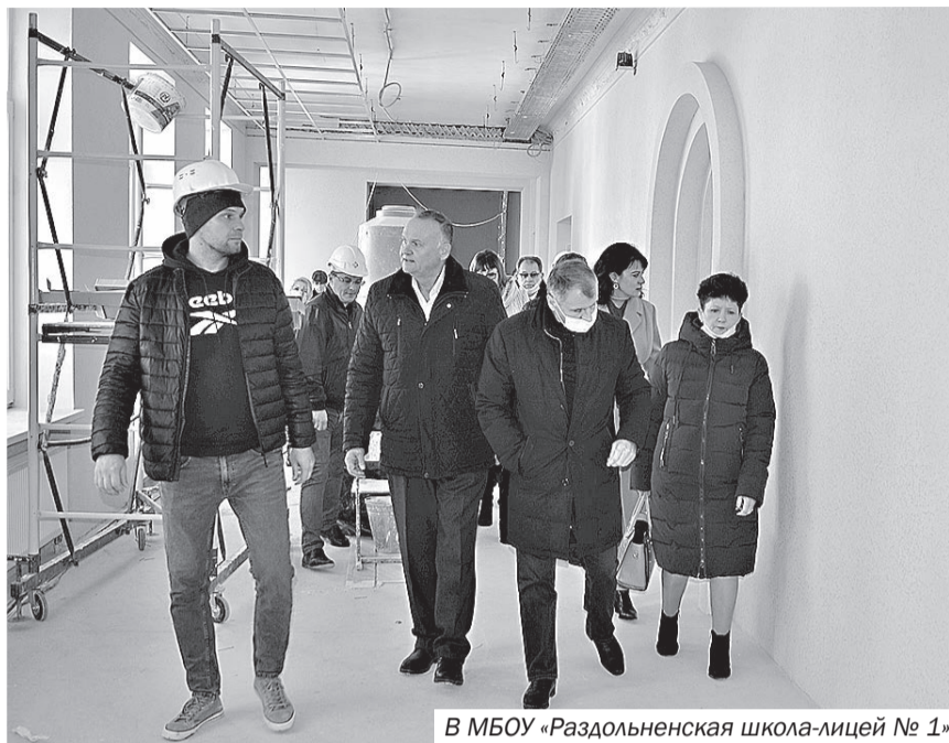
В МБОУ «Раздольненская школа-лицей № 1»