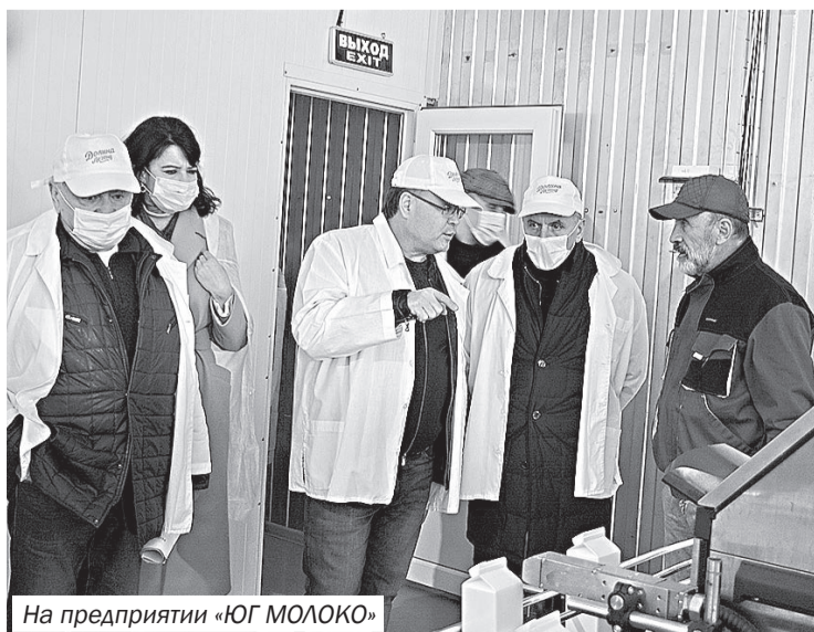
На предприятии «ЮГ МОЛОКО»

Далее Владимир Константинов осмотрел Раздольненскую школу-лицей № 1, где на данный момент идёт капитальный ремонт. Строительно-монтажные работы по контракту, заключённому 07.07.2021, ведёт ООО «ПМК «Стройград». Образовательное учреждение является базовым в районе по работе с одарёнными детьми. На базе школы с 2018 года открыт пункт сдачи государственной итоговой аттестации для обучающихся Раздольненского района, функционирует инженерный класс. Школа участвует в проекте «Успех каждого ребёнка» национального проекта «Образование».