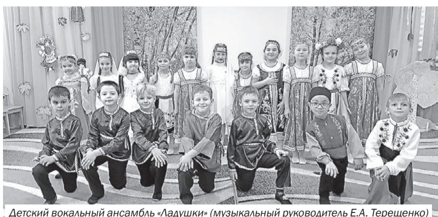
Детский вокальный ансамбль «Ладушки» (музыкальный руководитель Е.А. Терещенко)

«Россия – мощная держава, многонациональная страна! Пока народы в ней едины – она могуча и крепка!»