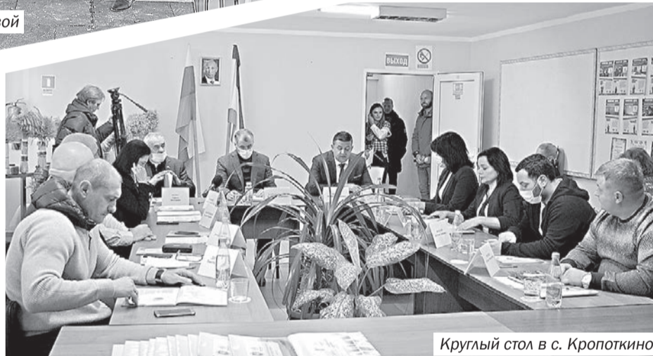
Круглый стол в с. Кропоткино