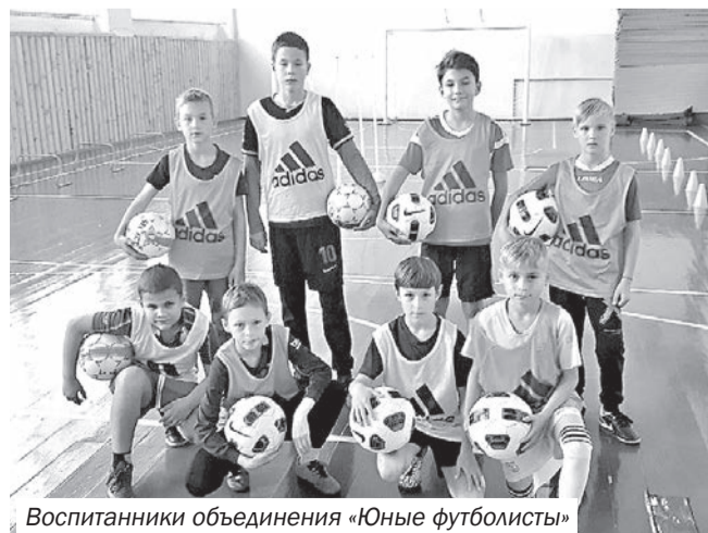
Воспитанники объединения «Юные футболисты»

предлагают новые и эффективные методики обучения, а государство предоставляет финансовую помощь на создание условий для их воплощения».