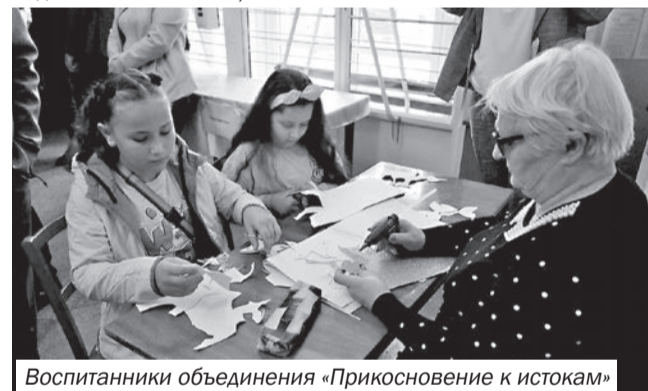
Воспитанники объединения «Прикосновение к истокам»