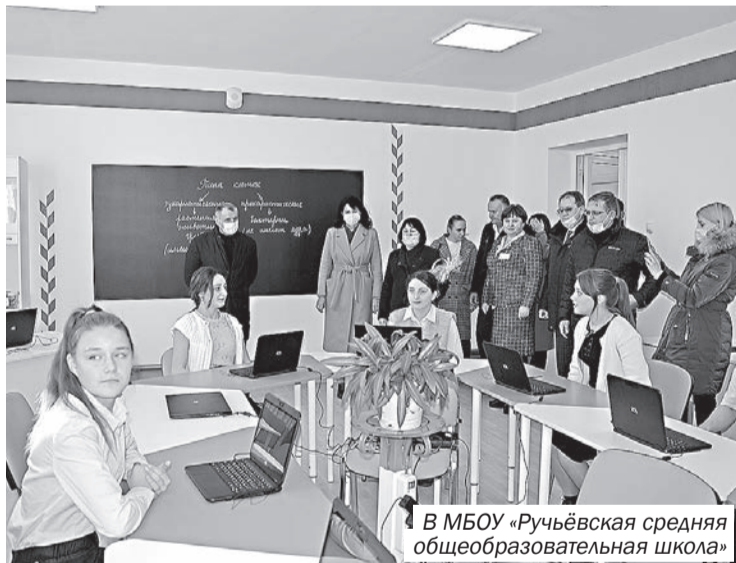
В МБОУ «Ручьёвская средняя общеобразовательная школа»

доснабжения, водоотведения, отремонтирована кровля. В детском саду планируется дополнительно открыть 3 группы в двух возрастных категориях.