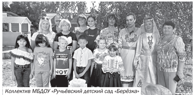
Коллектив МБДОУ «Ручьёвский детский сад «Берёзка»