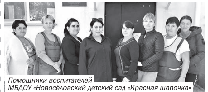
Помощники воспитателей МБДОУ «Новосёловский детский сад «Красная шапочка»

27 сентября мы празднуем наш профессиональный праздник и хотим пожелать, чтобы вы всегда были здоровы, бодры духом и веселы! Доброму вам сердцу, огромного терпения и большой любви к нашим маленьким озорникам! Пусть не очерствеют ваши души, не состарится оптимизм, не исчезнут с милых лиц приветливые улыбки! Будьте счастливы, живите в достатке, радости и благополучии! Теплоты вам и понимания, любви и уважения, красоты и радости на долгие годы!