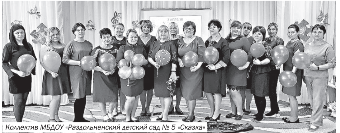
Коллектив МБДОУ «Раздольненский детский сад № 5 «Сказка»

С профессиональным праздником поздравляем уважаемых и самоотверженных работников МБДОУ «Раздольненский детский сад № 5 «Сказка»!