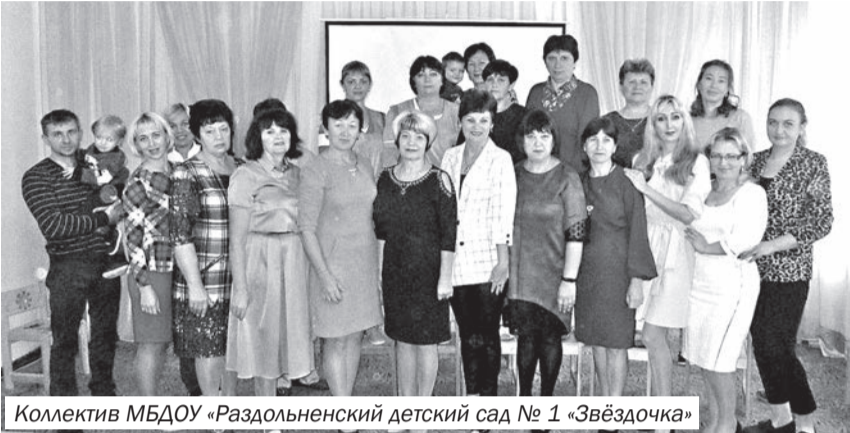
Коллектив МБДОУ «Раздольненский детский сад № 1 «Звёздочка»

Этим замечательным людям даже сама природа дарит хоромы золотых листьев, ведь совместно с семьёй они ведут по жизни маленького человека, отдавая свои тепло, любовь, заботу, внимание, оберегая от невзгод и формируя его личность. Воспитывают будущего гражданина нашей страны. Благодаря вашей доброте и мастерству каждый день ребёнка насыщен яркими радостными событиями.