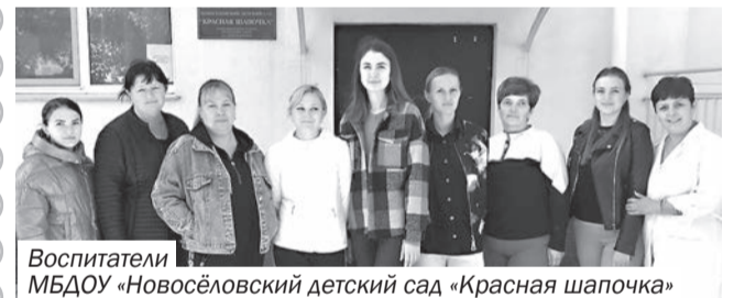
Воспитатели МБДОУ «Новосёловский детский сад «Красная шапочка»

Дорогие воспитатели и все работники МБДОУ «Новосёловский детский сад «Красная шапочка»!