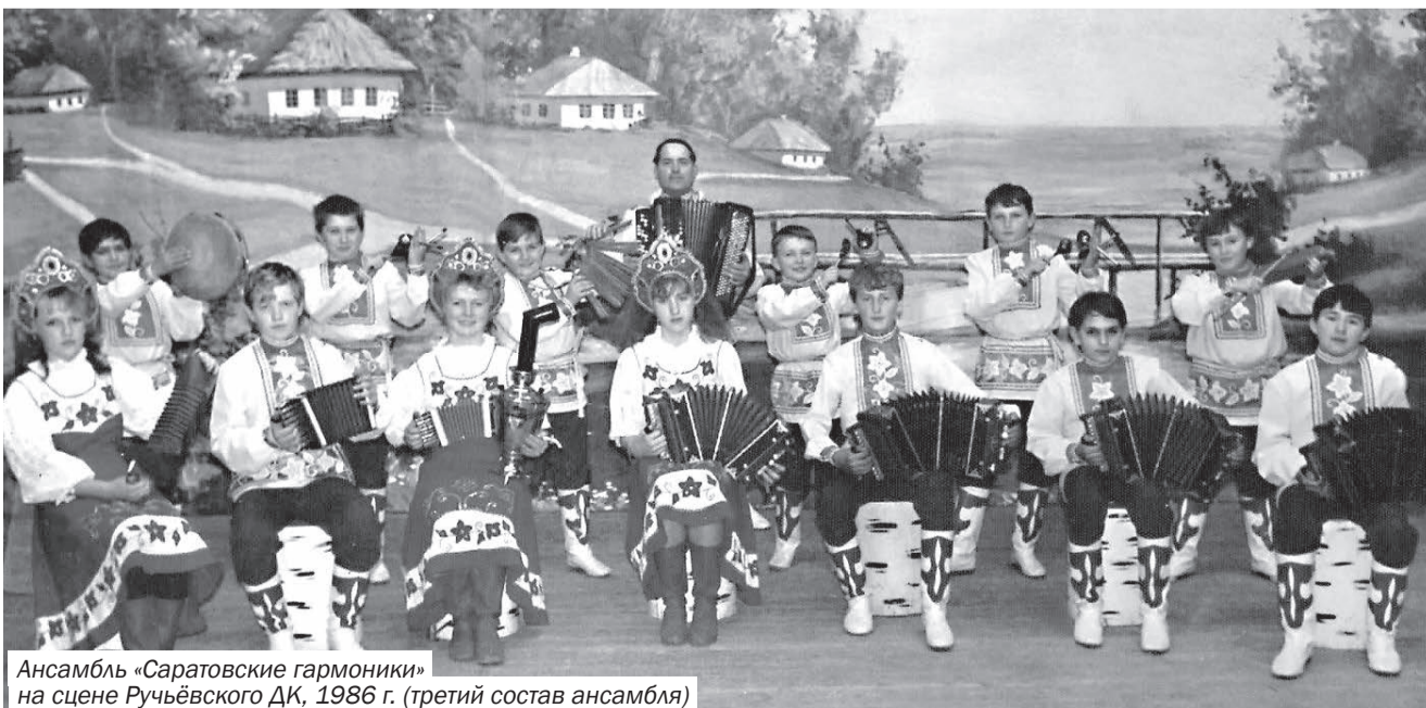
Ансамбль «Саратовские гармоники» на сцене Ручьёвского ДК, 1986 г. (третий состав ансамбля)