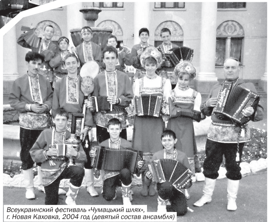
Всеукраинский фестиваль «Чумацкий шлях», г. Новая Каховка, 2004 год (девятый состав ансамбля)

вовне звучат оркестры». По итогам конкурса-фестиваля дипломом I степени Министерства образования, науки и молодёжи Республики Крым были награждены ансамбль народных инструментов «Саратовские гармоники» и ансамбль ложкарей «Русский сувенир». В 1992 г. ансамблю присвоено звание «Образцовый», которое подтверждалось 8 раз!