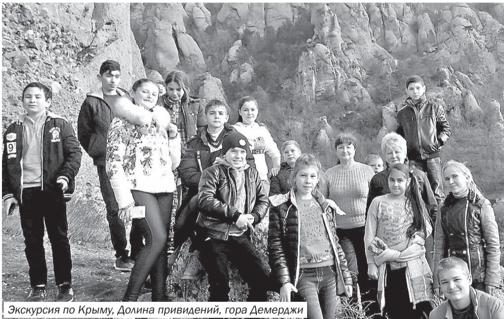
Экскурсия по Крыму, Долина привидений, гора Демерджи

Ведь не секрет, что в глазах её учеников никогда не угасает огонёк, они не теряют веры в свои силы, не чувствуют, что у них что-то не получается, потому что талантливый педагог умеет уважать детское «незнание». Как удивительно она умеет находить крупинцы творчества, смысл которых