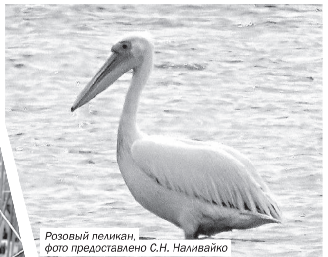
Розовый пеликан