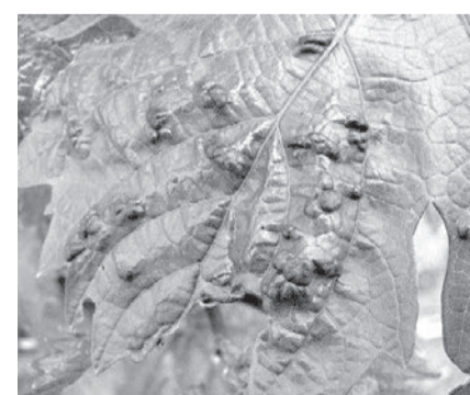
Войлочный клещ активизируется, если температура воздуха превышает +15 °С.

чего листья свертываются и свисают вниз. При хорошем развитии винограда поражаются, большей частью, только нижние листья. Второе поколение клещей поражает в середине лета верхние листья. Время от времени, особенно при высокой влажности воздуха, клещи поражают также и грозди винограда, которые покрываются войлоком и вследствие этого, обычно, непригодны для употребления. Сильному развитию клещей способствует жаркая, сухая погода. Распространяются клещи ветром, орудиями производства, посадочным материалом и т. д. Снижая фотосинтетическую активность листьев, клещи вызывают значительное снижение урожая и качество винограда.