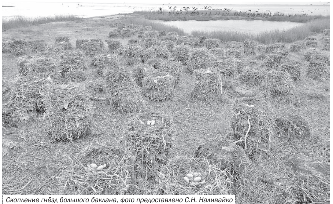
Скопление гнёзд большого баклана

«Особенно пристальная работа ведётся в связи с тем, что была прекращена подача пресной воды. Это, собственно говоря, второй бум на Лебяжьих островах. Первый был в конце 60-х, когда пустили пресную воду. Для зоны полупустынь такое обилие пресной воды вызвало капитальные перемены, потом обитатели флоры и фауны