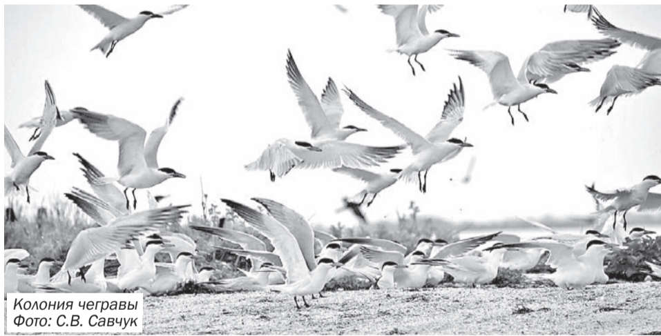
Колония чегравы