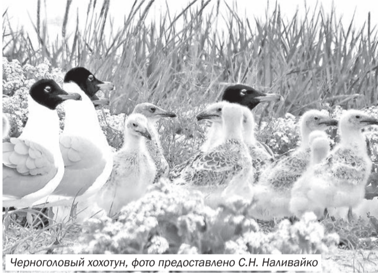
Черноголовый хохотун