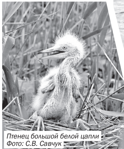
Птенец большой белой цапли

Наталья Александровна с любовью отзывается о своих «подопечных». Это очень кропотливая и трудоёмкая работа, отмечает она. Чтобы «войти в доверие» к пернатым, нужно использовать методы и подходы к изучению птиц. «Раньше для изучения поведения редких видов птиц, таких как черноголовый хохотун или чеграва, у нас были переносные скрадки, мы ставили бокс на расстоянии заранее, птицы привыкали к его присутствию. Чтобы птица быстро привыкла, нужно, чтобы к боксу пришло много людей и тут же ушло. Всех инспекторов, конечно, мы не привозили на катерах, приходилось из фанеры вырезать силуэты людей, подходить к птицам, далее опускать силуэты. Птицы, видя, что якобы люди ушли, начинали спокойно садиться на гнёзда и вести привычную свою жизнедеятельность. В это время сотрудник заповедника, спрятавшись в скрадке, проводил наблюдения. Сейчас, конечно, с наличием современной видеотехники возможности огромны», – рассказывает Наталья Александровна. Очень важны навыки в работе.