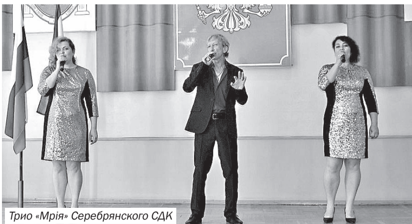
Трио «Мрія» Серебрянского СДК

Время, отведённое для праздника, пролетело быстро, но тот заряд оптимизма и бодрости, ощущение важности и значимости социальных служб, которые подарил этот праздник, надолго останутся ярким воспоминанием.