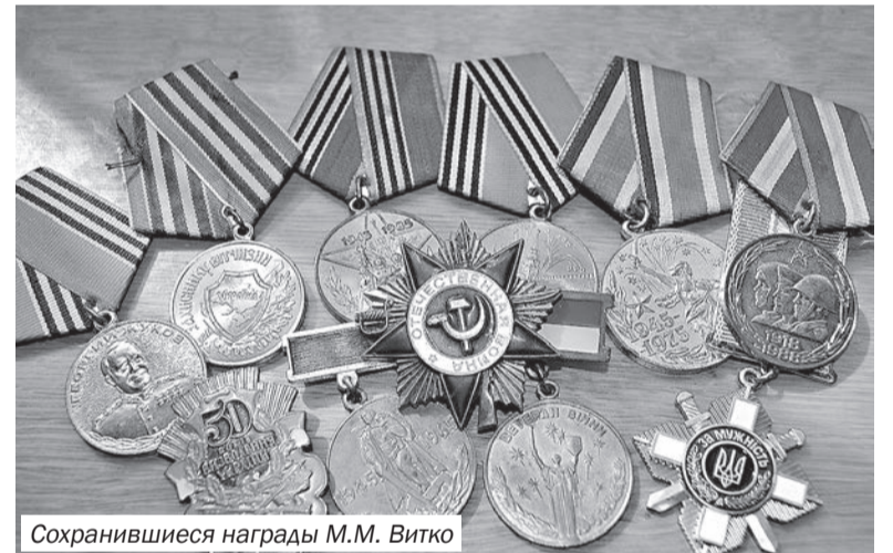
Сохранившиеся награды М.М. Витко