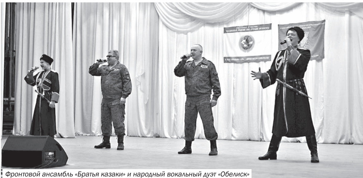
Фронтальной ансамбль «Братья казаки» и народный вокальный дуэт «Обелиск»