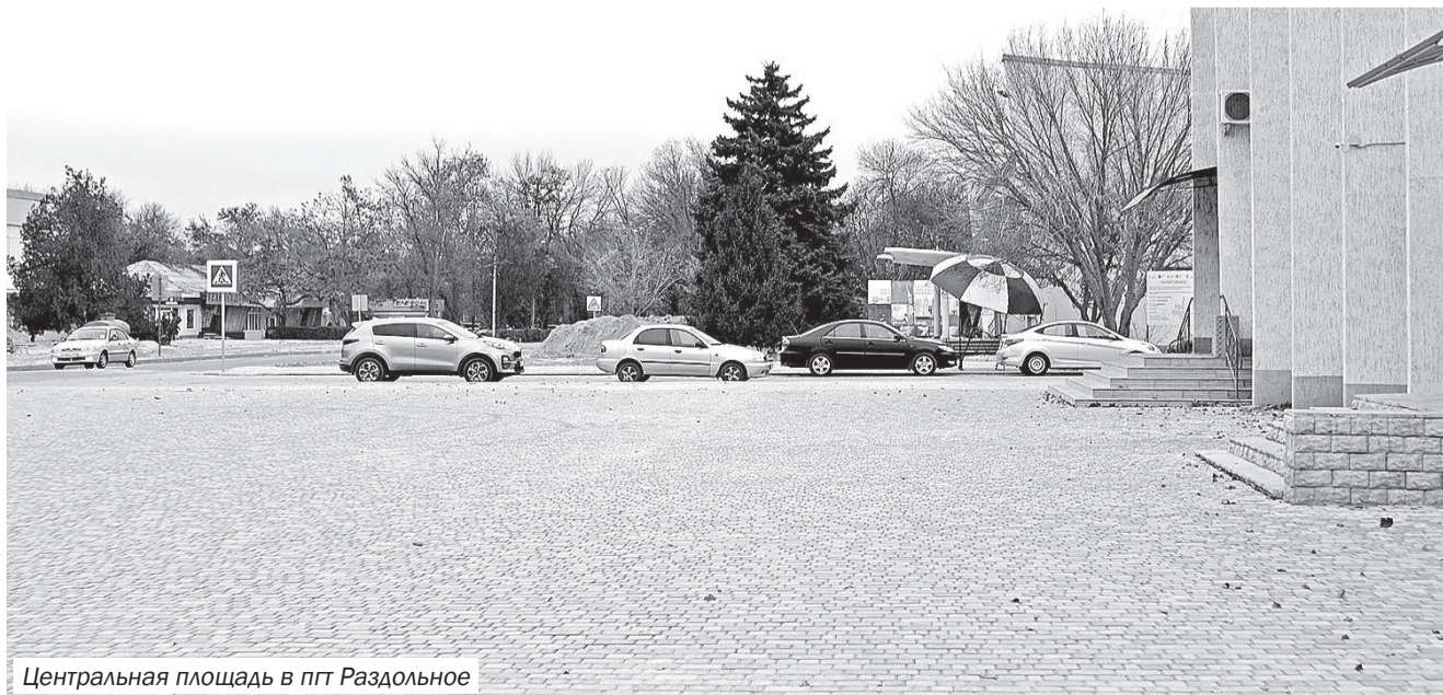
Центральная площадь в пгт Раздольное