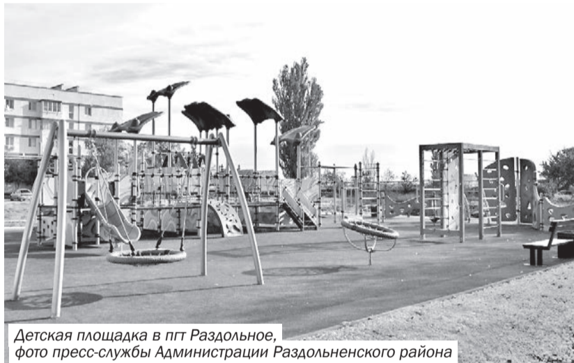
Детская площадка в пгт Раздольное

Также в рамках данной программы начались работы по обустройству 7 игровых универсальных спортивных площадок (мини-футбол, баскетбол и волейбол) в сёлах: Зимино, ул. Ленина, 1-А, Березовка, ул. Гагарина, 44, Ботаническое, ул. Дубинина, 9В, Кропоткино, ул. 40 лет Победы, 35Б, Славное, ул. Ленина, 13, Серебрянка, ул. Виноградная, 2Б; в пгт Новосёловское, ул. Ленина, 39-а. Для строительства данных площадок выделено