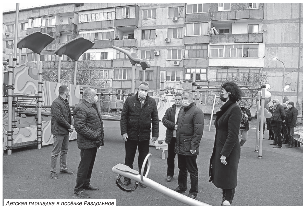
Детская площадка в посёлке Раздольное