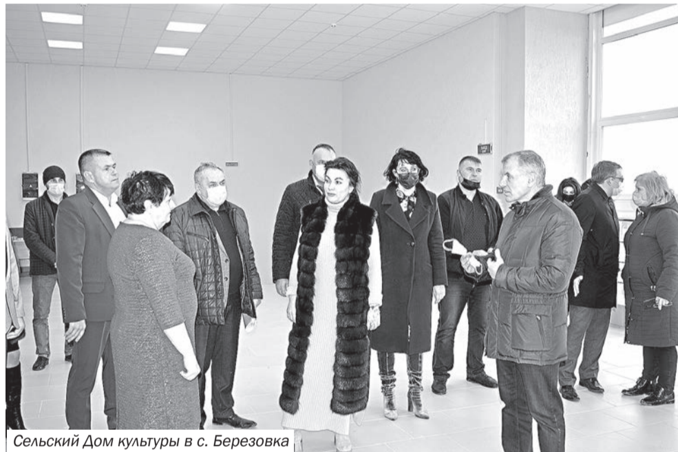
Сельский Дом культуры в с. Березовка