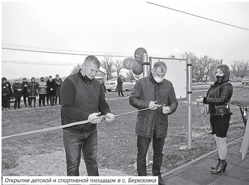
Открытие детской и спортивной площадок в с. Березовка

Также участники мероприятия посетили Раздольненский парк, где возложили цветы к Памятному знаку в честь воинов-односельчан, погибших в годы Великой Отечественной войны, и проконтролировали ход капитального ремонта территории парка. Благоустройство парка проходит в рамках реализации