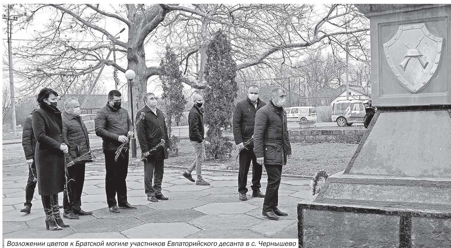
Возложения цветов к Братской могиле участников Евпаторийского десанта в с. Чернышево

Кроме того, Владимир Константинов посетил центральную площадь, на которой проводится капитальный ремонт и благоустройство. В рамках муниципальной целевой программы «Формирование современной городской среды» на объекте были проведены работы по ремонту, устройству парковки, тротуаров,