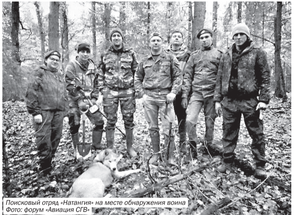
Поисковый отряд «Натангия» на месте обнаружения воина