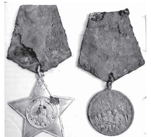
Награды: орден Славы III степени и медаль «За оборону Сталинграда»

Захваченного лётчика немцы, вероятно, отправили в ближайший лагерь для военнопленных при станции Штаблак, находившийся близ г. Пройсиш-Эйлау (нынешний Багратионовск). Перед его занятием нашими наступающими частями пленных эвакуировали, отправили морем через порт Пиллау (Балтийск) в Германию: документы свидетельствуют о пребывании лётчика до конца войны в лагере № 13-Б, военный округ «Нюрнберг». Но территория лагеря № 1-А Штаблак занимала как раз та стрелковая дивизия, в которой служил красноармеец из Ленинграда, чьи останки, как теперь предполагается, были найдены поисковиками. Не исключено, что солдат нашёл его где-нибудь в комендатуре лагеря среди наград, отнятых немцами у пленных, и взял его с собой.