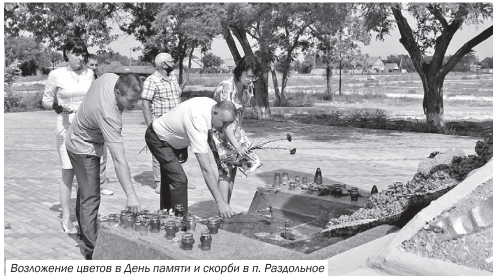
Возложение цветов в День памяти и скорби в п. Раздольное

80 лет назад 22 июня 1941 года фашистская Германия без объявления войны напала на Советский Союз, началась Великая Отечественная война, в которой погибли десятки миллионов человек. Этот день в России был объявлен Днём памяти и скорби о тех, кто погиб, сражаясь за Родину. В этот день во всех регионах России прошли памятные мероприятия.