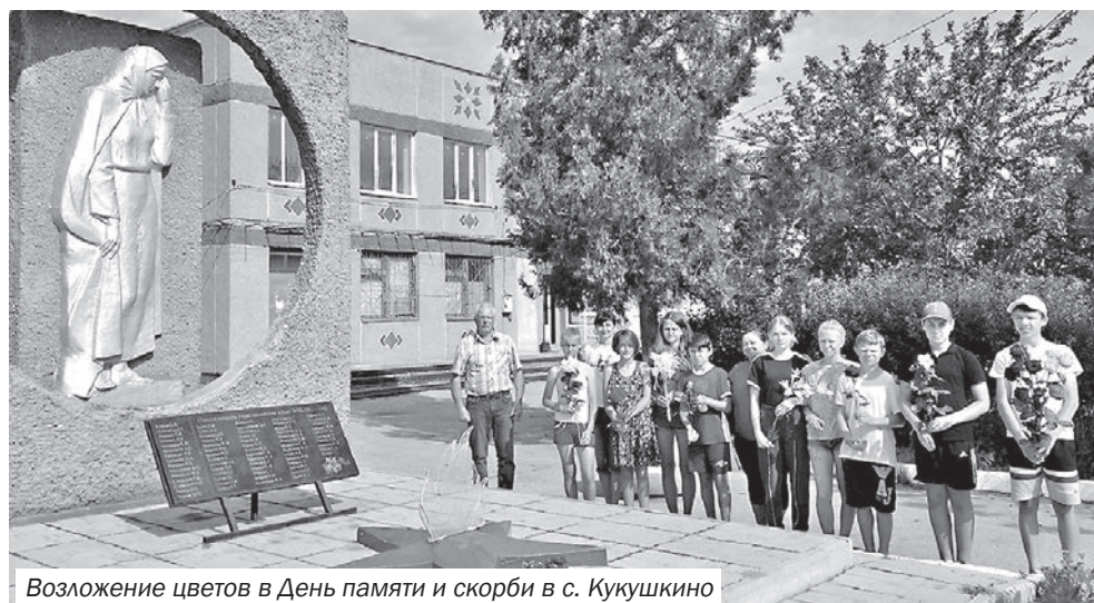
Возложение цветов в День памяти и скорби в с. Кукушкино

Так, 22 июня жители Раздольненского района почтили подвиг погибших в Великой Отечественной войне минутой молчания, возложили цветы к памятникам и обелискам Великой Отечественной войны, а также приняли участие во Всероссийской акции «Свеча памяти».