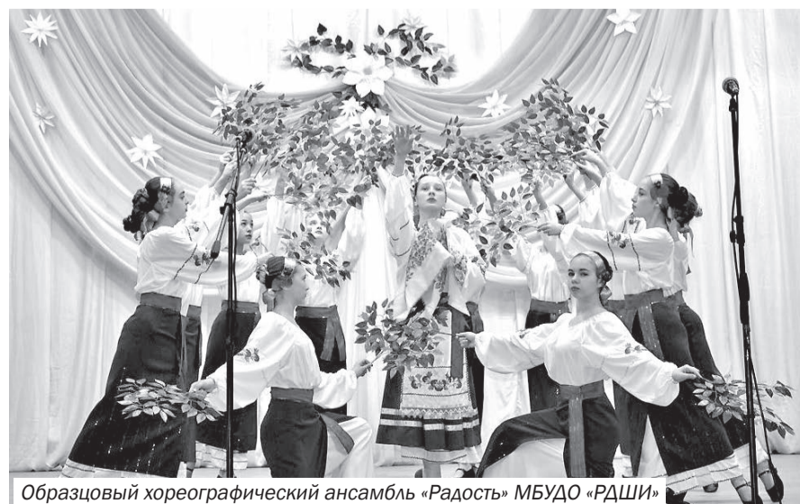
Образцовый хореографический ансамбль «Радость» МБУДО «РАШИ»

Мероприятие традиционно прошло в тёплой праздничной атмосфере. Администрация Раздольненского района поздравляет всех работников культуры с полученными наградами, ваши благодарные зрители ждут от вас новых творческих свершений и скорых встреч!