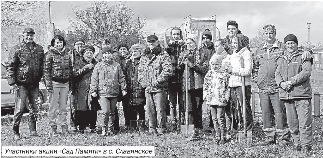
Участники акции «Сад Памяти» в с. Славянское