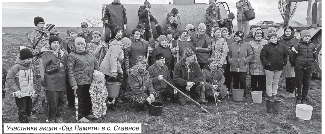
Участники акции «Сад Памяти» в с. Славное