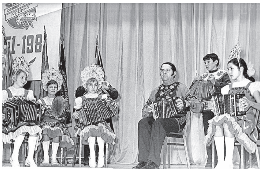
1981, на сцене Ручьевского СДК, первый состав ансамбля

Со временем расширилась не только география выступлений детского коллектива, но и увеличилось количество полученных грамот, дипломов, призов и благодарностей. Лучше и разнообразнее становился реперту-