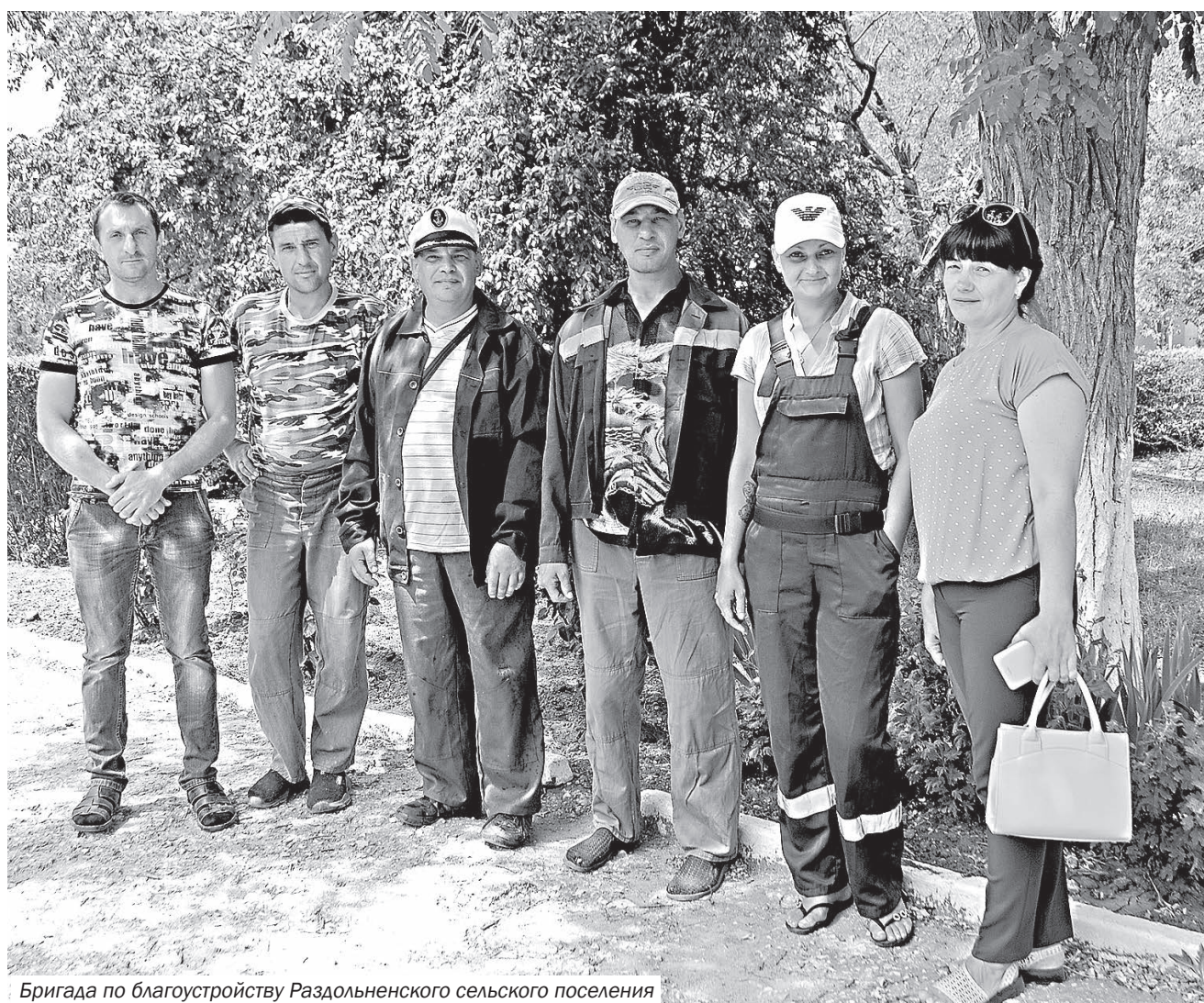
Бригада по благоустройству Раздольненского сельского поселения

Благодаря ежедневному кропотливому труду бригады поддерживается чистота у памятника участникам ликвидации аварии на Чернобыльской АЭС. Весной 2019 года здесь были высажены деревья: ясени, клёны, туи. Разумным решением для полива растений было проложить систему капельного орошения. На данный момент деревья принялись, хорошо укоренились, у памятного знака регулярно проводится покос травы. Работниками поселкового совета также осуществляется уход за территорией вблизи памятного знака в честь трудящихся, строивших и развивавших наш посёлок (памятный знак – автомобиль ГАЗ-51А).