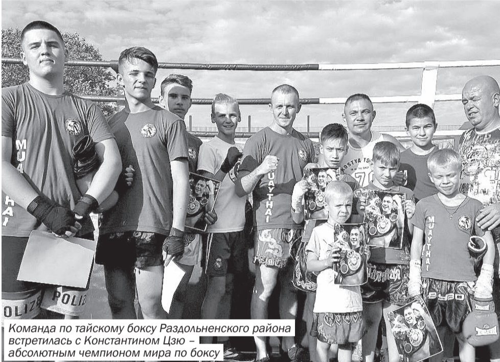
Команда по тайскому боксу Раздольненского района встретилась с Константином Цзю – абсолютным чемпионом мира по боксу