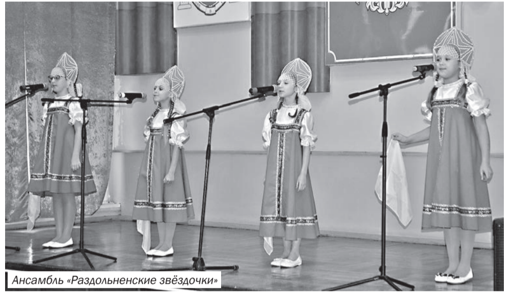
Ансамбль «Раздольненские звёздочки»

В этот день также были награждены почётными Грамотами Председателя Совета муниципальных образований Республики Крым двое учащихся Раздольненского