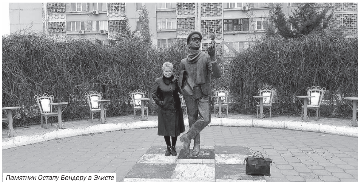
Памятник Остапу Бендеру в Элисте