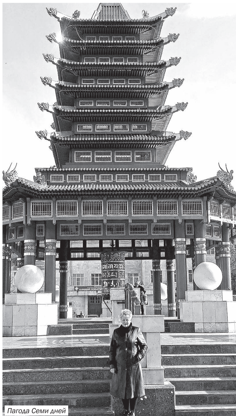
Пагода Семи дней

ной войны. Кстати, в процентном отношении по количеству героев Калмыкия занимает 2 место после Осетии.