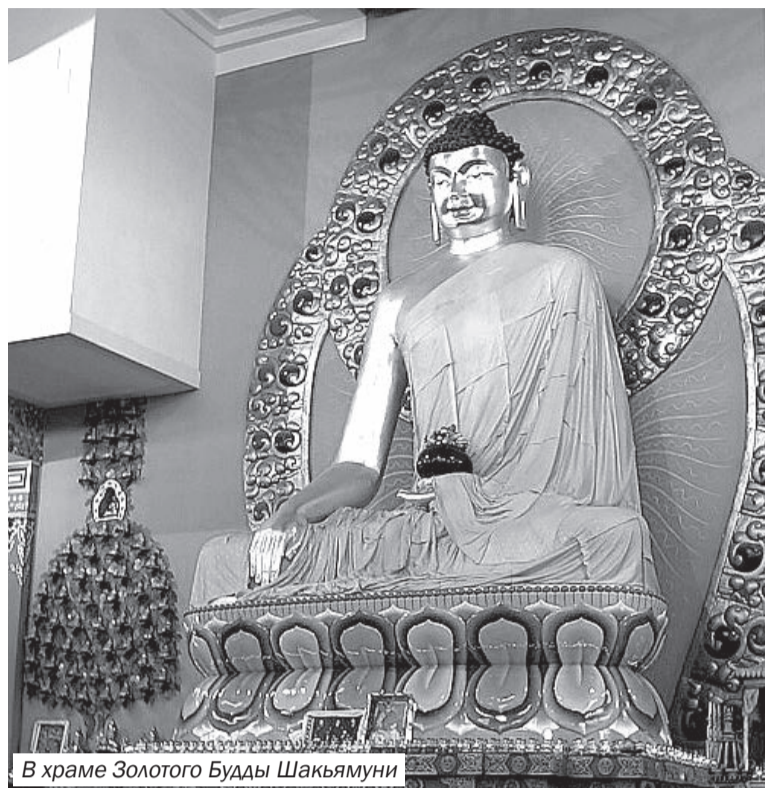
В храме Золотого Будды Шакьямуни