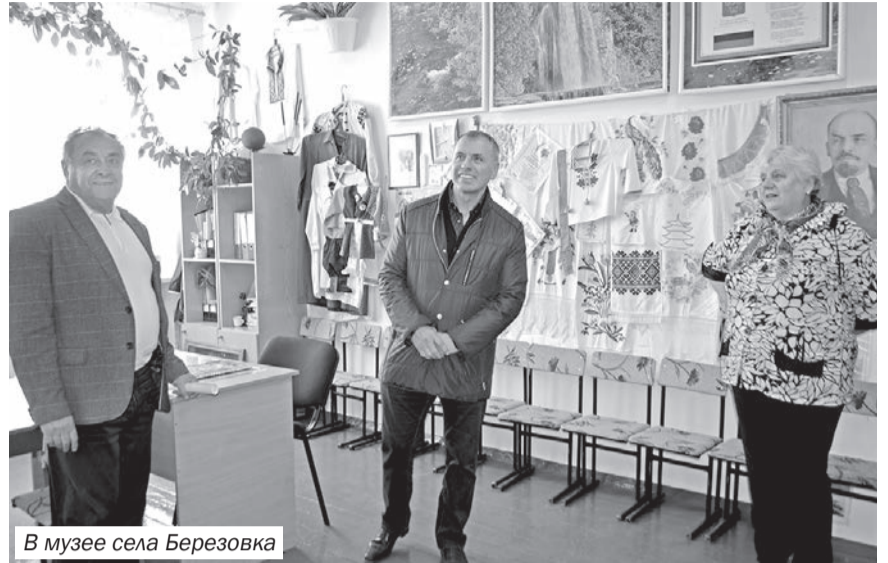
В музее села Березовка