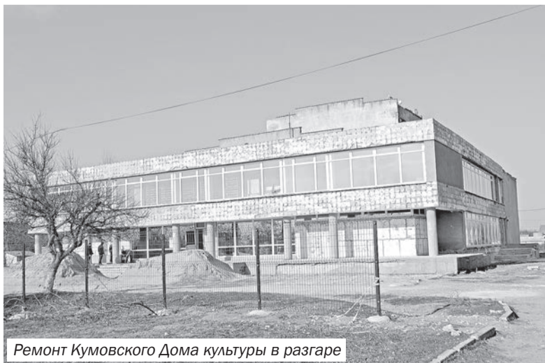
Ремонт Кумовского Дома культуры в разгаре

УВАЖАЕМЫЕ ЧИТАТЕЛИ! ПРИГЛАШАЕМ ВСЕХ ЖЕЛАЮЩИХ ОФОРМИТЬ ПОДПИСКУ НА РАЙОННУЮ ГАЗЕТУ «АВАНГАРД»