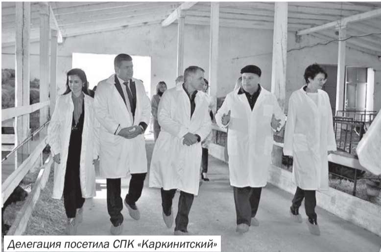
Делегация посетила СПК «Каркинитский»