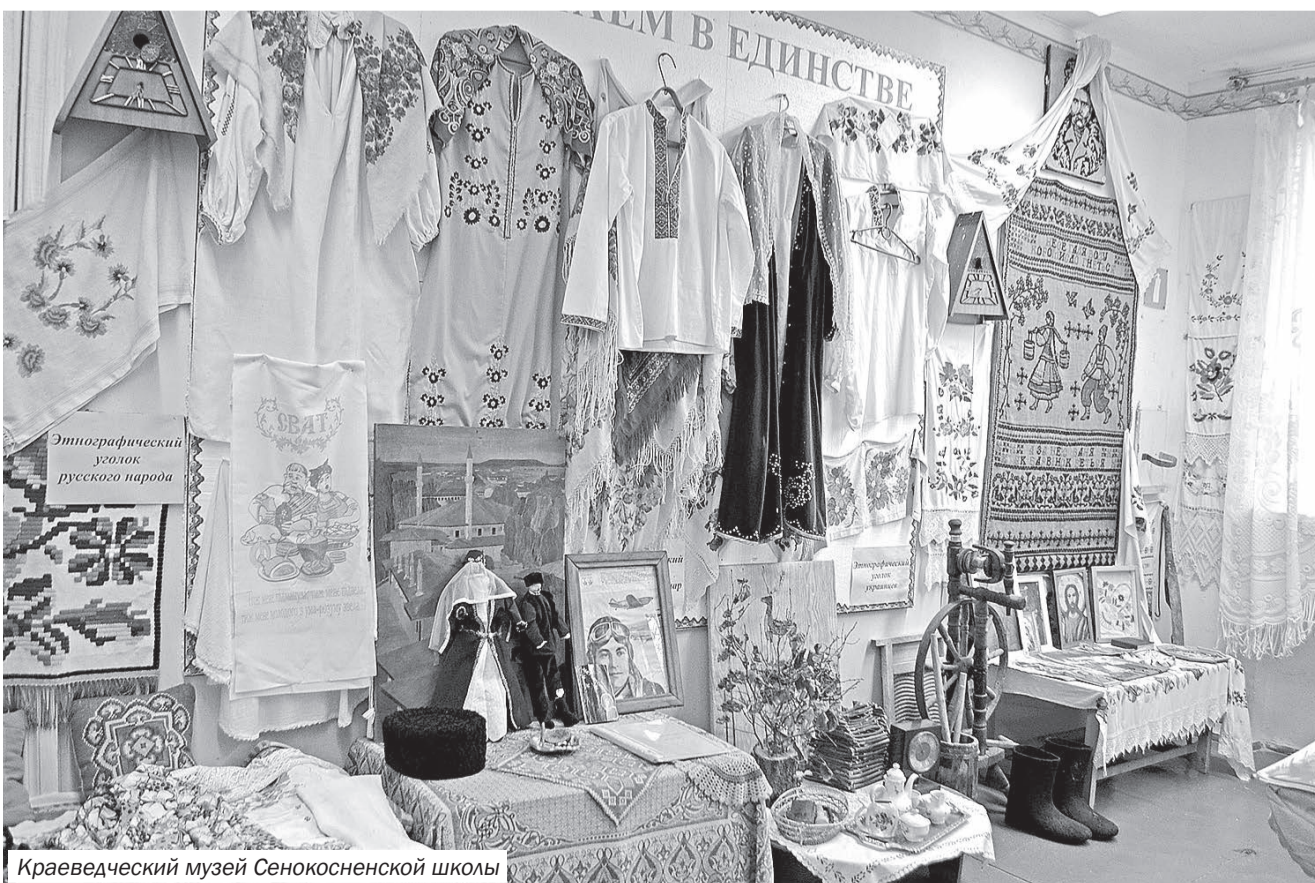
Краеведческий музей Сенокосненской школы