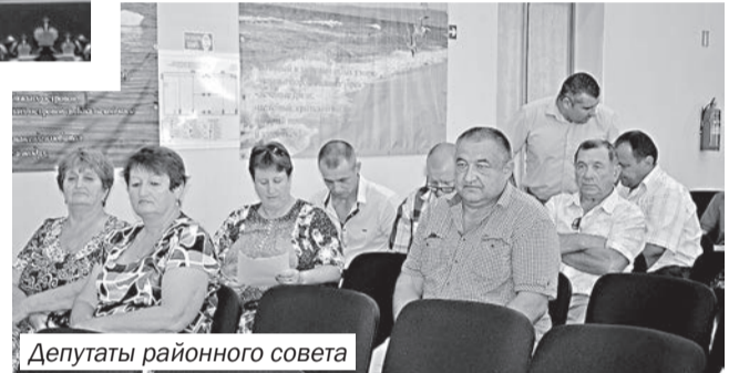
Депутаты районного совета