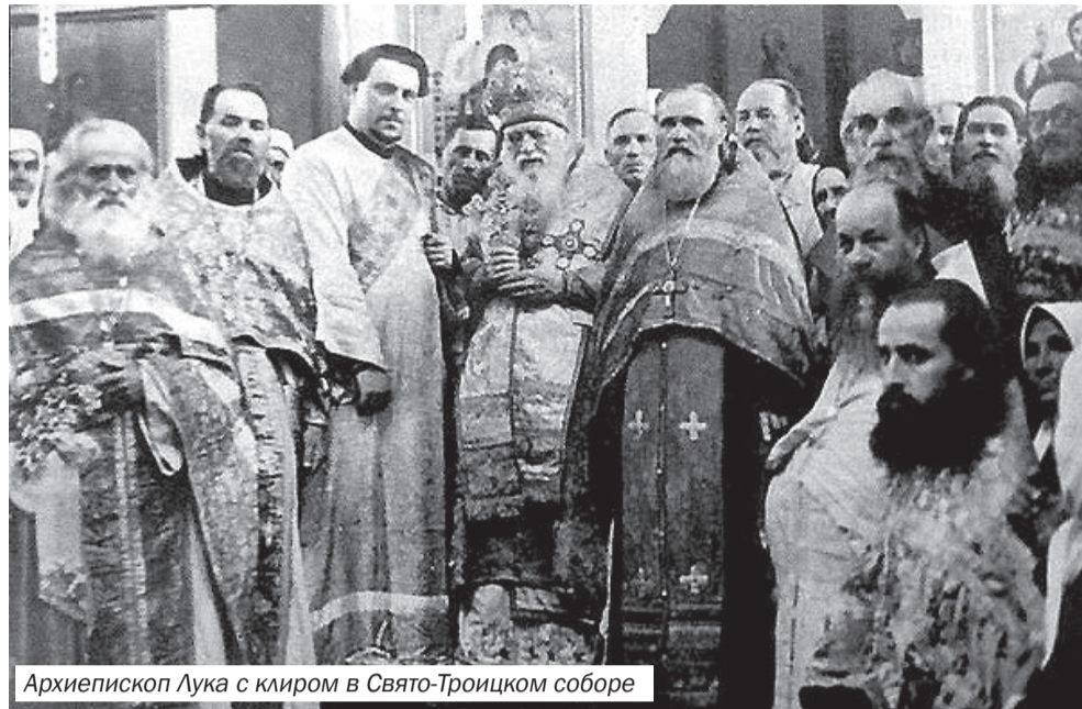
Архиепископ Лука с клиром в Свято-Троицком соборе

В нём имеется современное медицинское оборудование и всё необходимое для работы врачей: рентгенологический кабинет, УЗИ, кабинет функциональной и лабораторной диагностики, эндоскопический кабинет, стоматология, перевязочная, урологический, хирургический кабинеты и др. Он позволяет людям, живущим далеко от городов, получить квалифицированную медицинскую помощь.